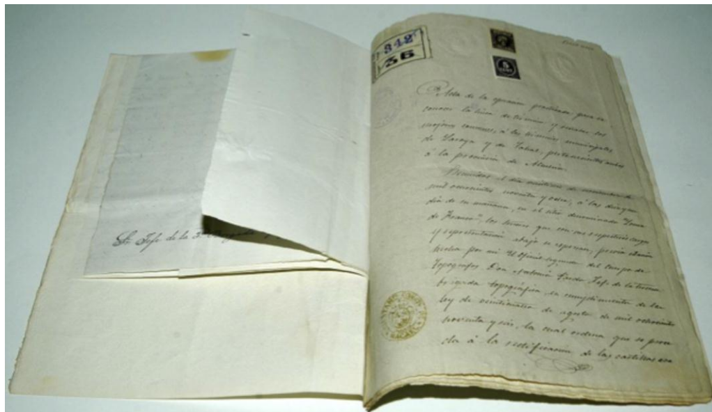
Fotografía 1 - Acta de deslinde

Las actas de deslindes son los títulos jurídicos originales donde se describe de forma literal la situación de los distintos mojones de la línea límite y la forma de unión entre ellos, y en los cuales los ayuntamientos limítrofes aprueban y dan conformidad o no, a los límites municipales expuestos. El número de documentos de este tipo es de 36.000.