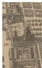
Casa de Campo