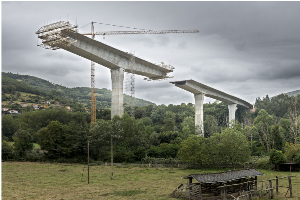
Viaducto sobre el Narcea en noviembre de 2016