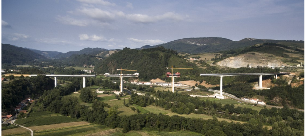
Viaducto sobre el Narcea en noviembre de 2016