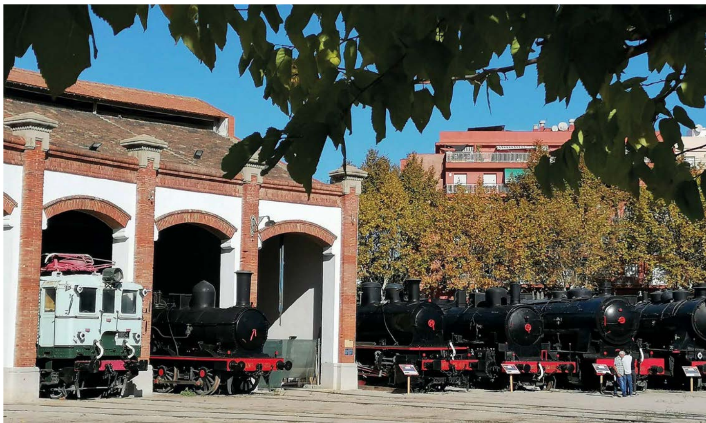
Exterior del Museo del Vilanova con algunas de sus 24 locomotoras de vapor.