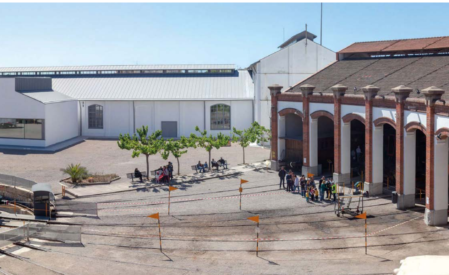
Panorámica del exterior del Museo en la histórica Rotonda de Vilanova i la Geltrú.