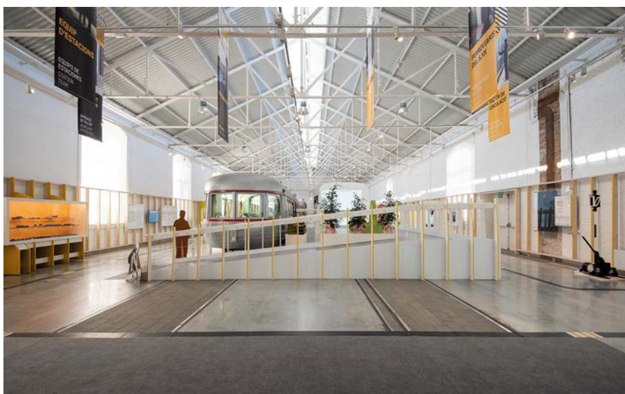
Vista general de la Gran Nave, con elementos del “Viaje en el Tren del Tiempo”.