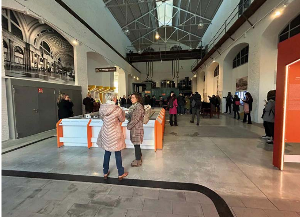
Visitas a la nave del Puente-Grúa, la primera nave histórica del recorrido.

El Museo se encuentra situado en la ciudad costera de Vilanova i la Geltrú, equidistante 45 kilómetros entre Barcelona y Tarragona. Una población en la que el ferrocarril ha estado muy presente y que en la actualidad se erige como la capital educativa del ferrocarril en Cataluña, al concentrarse en ella los principales estudios universitarios y de formación profesional en materia ferroviaria, además del amplio programa didáctico del Museo. Para llegar a la población y a las