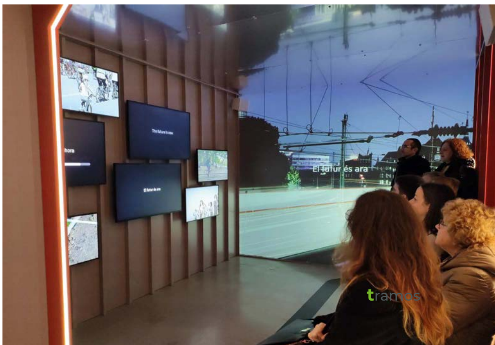
Sala inmersiva en la exposición “Viaje en el Tren del Tiempo”.