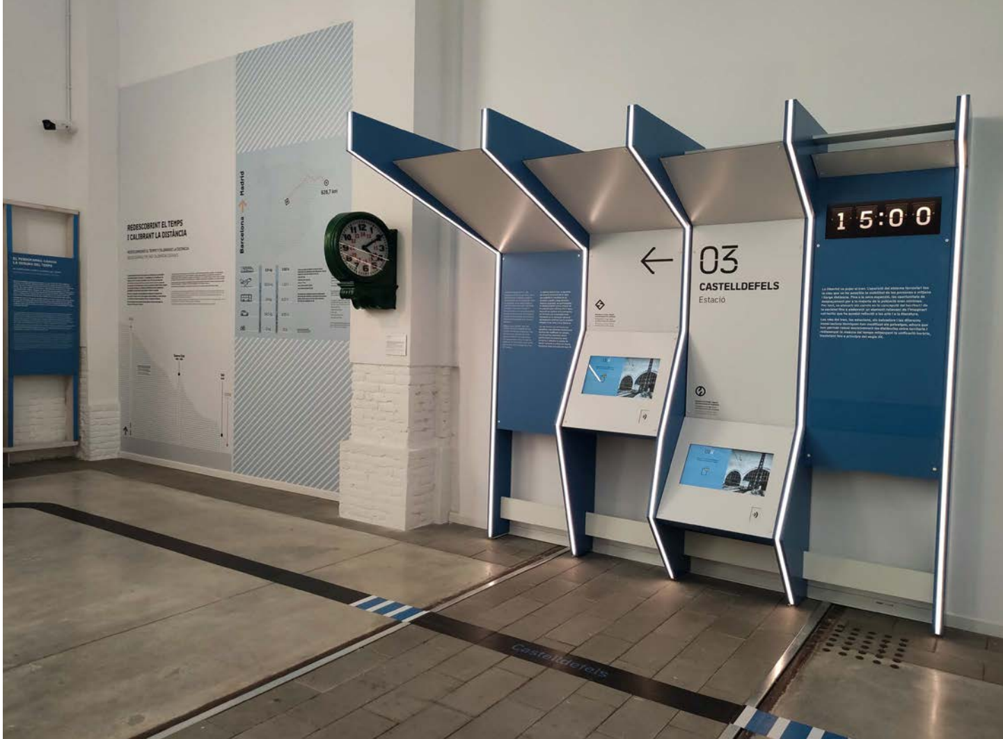
Castelldefels, tercera estación en el recorrido virtual que propone la exposición.

instalaciones museísticas son muchas las personas que se decantan por el tren. De hecho, es la mejor manera de comenzar la visita. Un desplazamiento que permite captar la gran frecuencia de servicios de Cercanías y regionales de una línea que bordea los acantilados del Mediterráneo. La movilidad ferroviaria abre la posibilidad de convivir, de sentirnos parte de la comunidad en la que vivimos. En el tren podemos descubrir una serie de valores que en el Museo se harán todavía más implícitos.