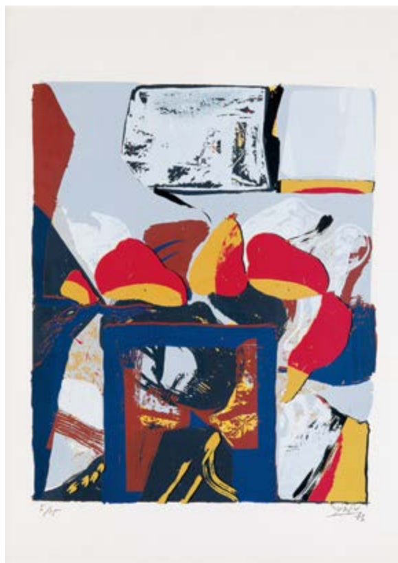
Serigrafía de Antonio Suárez. Fundación ENAIRE.

Las Naves de Gamazo son una de las joyas de la arquitectura industrial de Santander. Nombradas