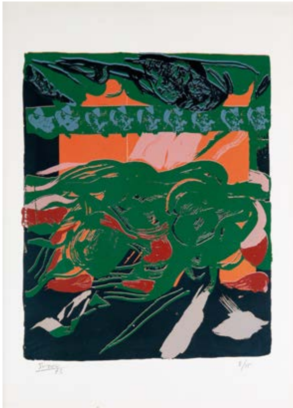
Serigrafía de Antonio Suárez. Fundación ENAIRE.

Las Naves de Gamazo en Santander son la primera sede permanente de la Colección ENAIRE de Arte Contemporáneo, un ejemplo de colaboración entre administraciones que ha sido posible gracias a la alianza y al trabajo conjunto de Mitma, del Gobierno de Cantabria –a través de la Consejería de Cultura, Turismo y Deporte– y de la Autoridad Portuaria de Santander para la financiación compartida de los gastos de funcionamiento del centro, lo que permite asegurar la sostenibilidad actual y futura de este proyecto cultural.