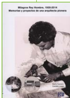
Autores: María Carreiro Otero y Cándido López González Edita: Editorial Club Universitario