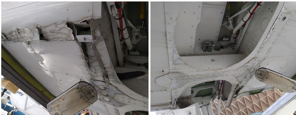
Figura 5. Daños en parte inferior del fuselaje

En las imágenes de la Figura 5 pueden observarse los daños en las zonas adyacentes a los compartimentos del tren principal.