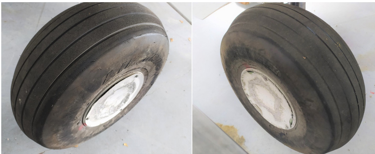
Figura 10. Ruedas del tren principal

Se comprobó que las ruedas del tren principal presentaban rozaduras en los tapacubos, no encontrándose daños apreciables en los neumáticos, como puede verse en la Figura 10.