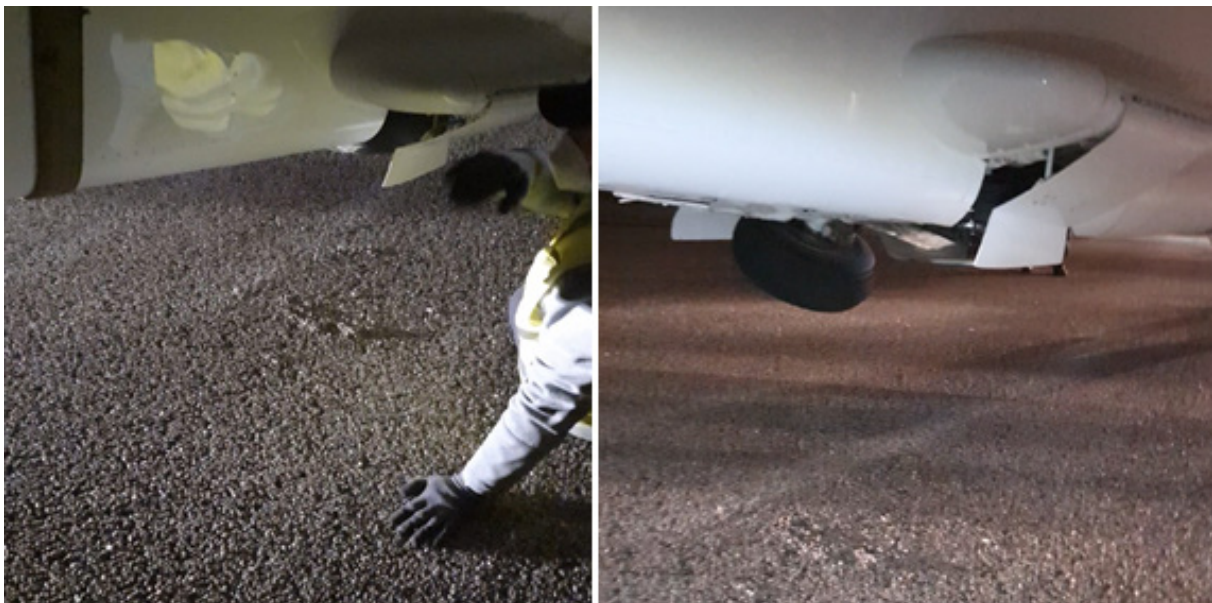
Figura 4. Izado de aeronave

Tras ser izada posteriormente por medio de una grúa para transportarla al hangar, se comprobó que las compuertas del tren principal se encontraban abiertas, como puede apreciarse en la Figura 4.