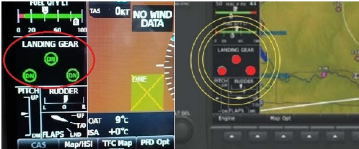
Figura 11. Luces indicadoras del tren en cabina

Se observó igualmente cómo se encendían en cabina tanto las luces indicadoras de transición, como las luces verdes que indican la extensión y bloqueo de las patas correspondientes (Figura 11).