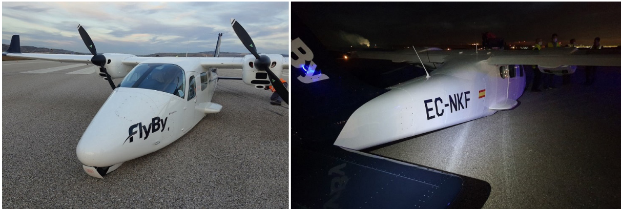
Figura 3. Posición final aeronave EC-NKF

La aeronave quedó detenida en la pista a 600 m de la cabecera 22. Se comprobó que había marcas de arrastre sobre la pista producidas por el fuselaje a lo largo de aproximadamente 130 m.