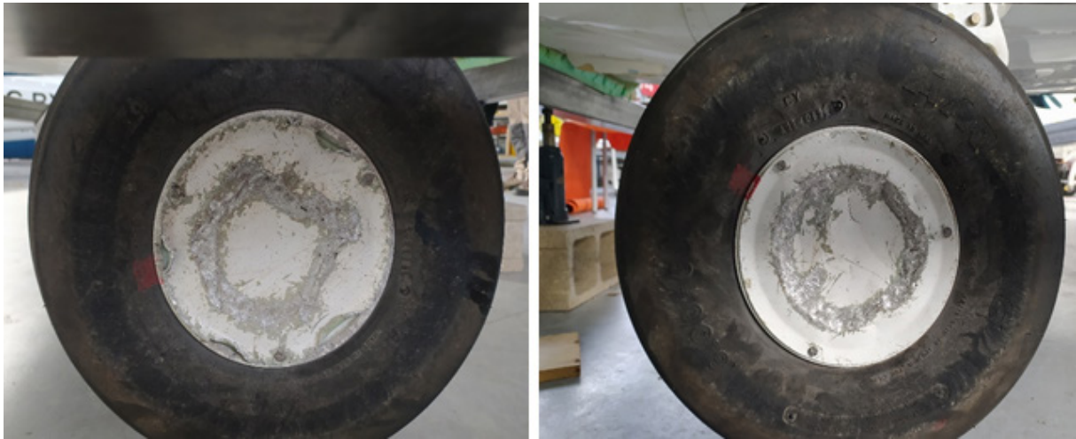
Figura 7. Daños en llantas de las ruedas del tren principal

En la Figura 7 se aprecian los daños en las llantas de las ruedas izquierda y derecha del tren principal respectivamente.