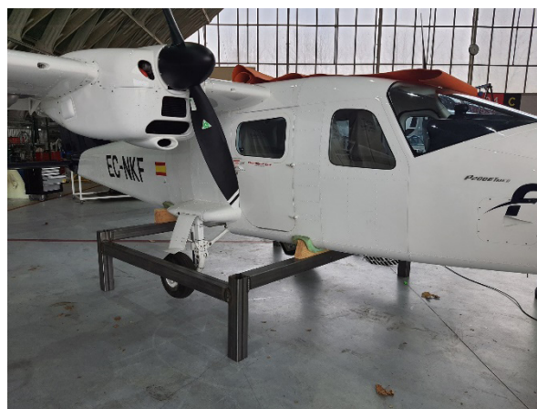
Figura 8. Aeronave en hangar

La presión del acumulador del sistema hidráulico era correcta y la batería del sistema eléctrico tenía carga suficiente para accionar el tren.