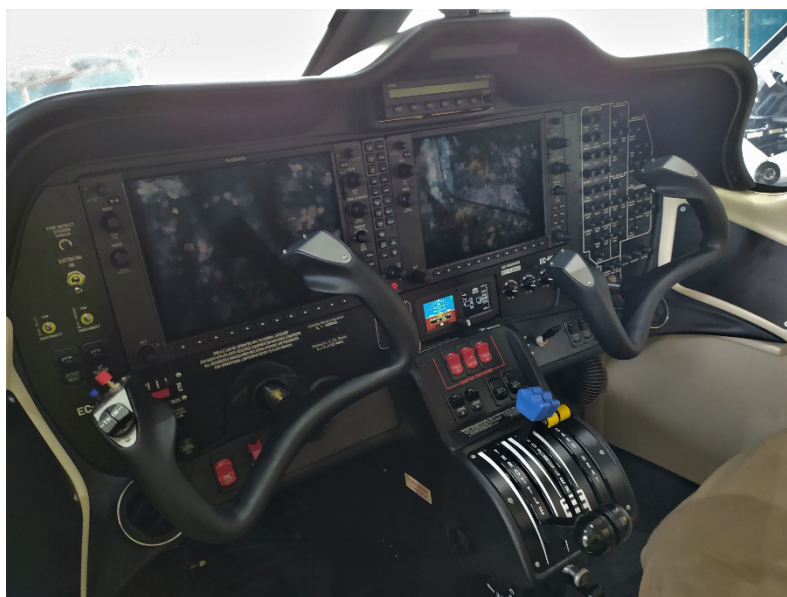
Figura 1. Panel de instrumentos aeronave EC-NKF

Es una aeronave bimotor de ala alta, con una masa máxima al despegue de 1180 kg y equipada con dos motores ROTAX 912. En el momento del accidente aeronave y motores contaban con 189 h de funcionamiento.