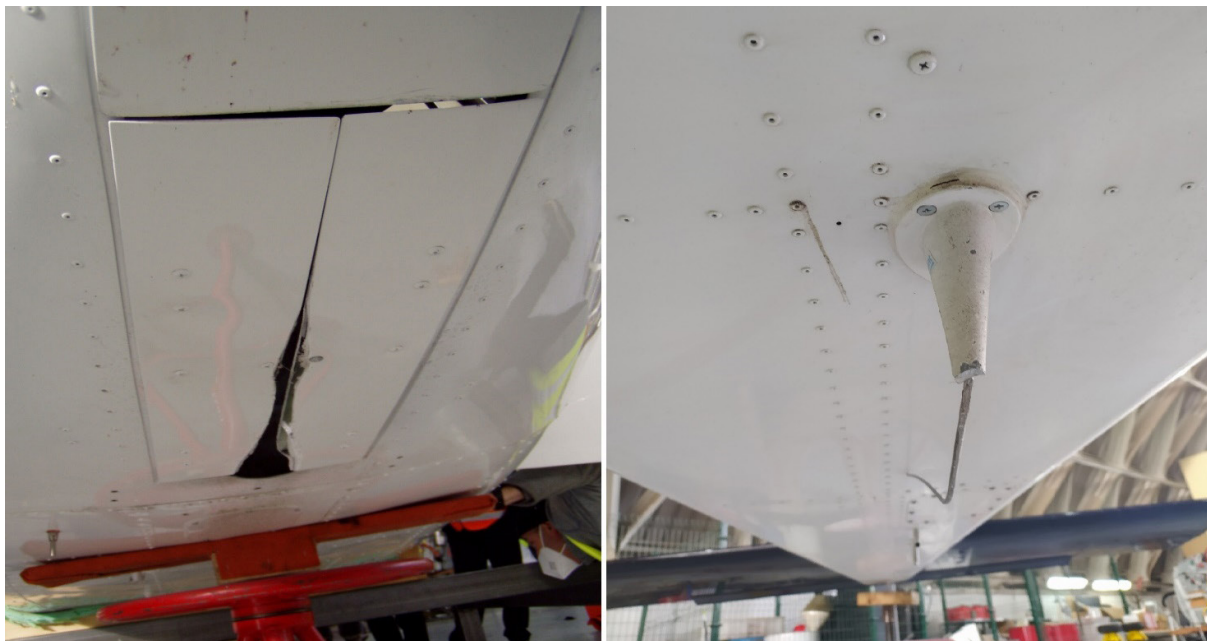
Figura 6. Daños en compuerta de pata de morro y antena

En la Figura 6 pueden verse los daños producidos en las compuertas de la pata de morro, así como en la antena situada bajo el fuselaje.