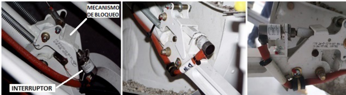
Figura 9. Microinterruptores y mecanismos de bloqueo de las patas del tren

En las fotografías de la Figura 9 pueden verse los interruptores y mecanismos de bloqueo en extensión de las patas del tren de morro, izquierda y derecha respectivamente.