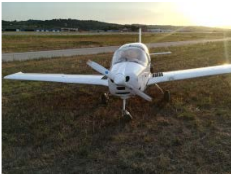
Figura 1. Fotografía de la aeronave en el lugar en el que se detuvo

Según la declaración del alumno piloto, en la segunda toma contactó con la pista desviado unos tres metros del eje. Puso gases a ralentí y actuó sobre el mando de flaps para ponerlos en posición de despegue.