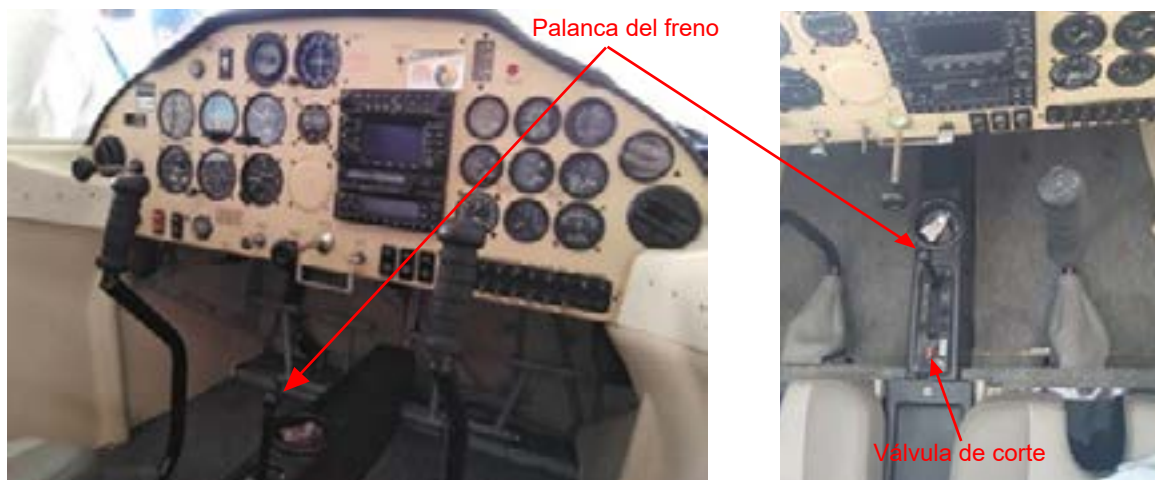
Figura 2. Fotografía general de la cabina (izquierda) y de detalle (derecha) sobre las que se ha señalado la posición de la palanca de accionamiento del freno y de la válvula de corte (freno de aparcamiento)

Para activar el freno de aparcamiento hay que actuar sobre la palanca de freno y poner la válvula de corte en la posición de cierre.