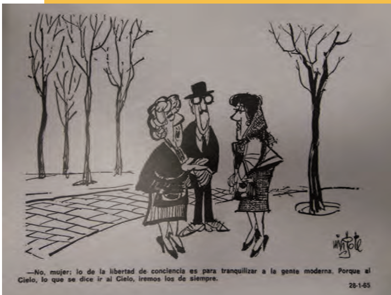
► Antonio Mingote.