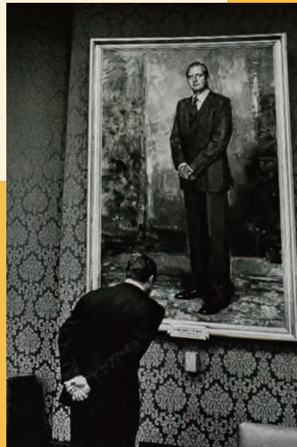
► Dos imágenes especialmente simbólicas de la etapa. Encima de estas líneas primeras noticias de la muerte de Franco. A la derecha el Rey Juan Carlos I examina su retrato.