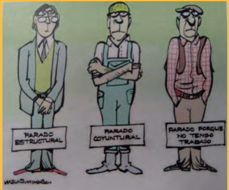
► Francisco Martín Morales.