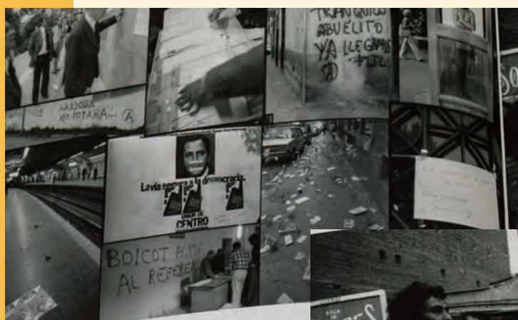
► Dos imágenes firmadas por Antonio Suárez. Collage preelectoral y Orgullo Gay.

Bernardo Pérez: La España que cambió (reportaje fotográfico varios autores).