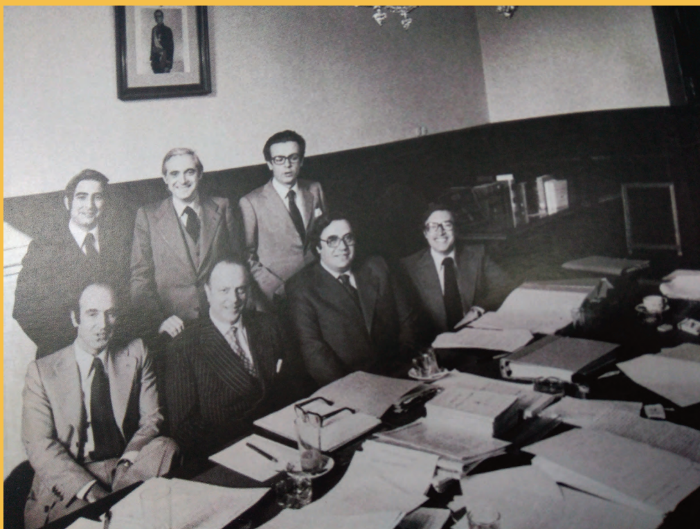
► Los padres de la Constitución.