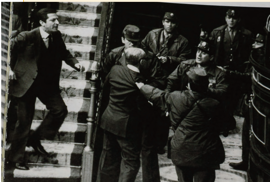
► Fotografías del 23 F.