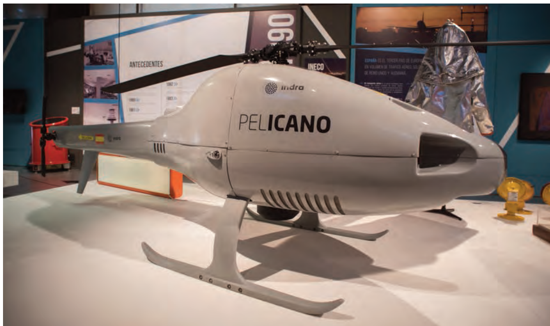
► Dron Pelicano de Indra.