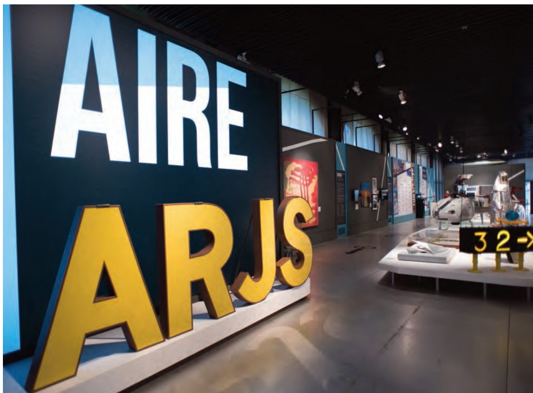
► Vista de la exposición parte AIRE.