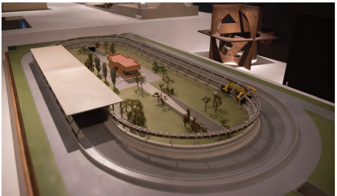
► Maqueta de la pista experimental de carreteras (CEDEX.)