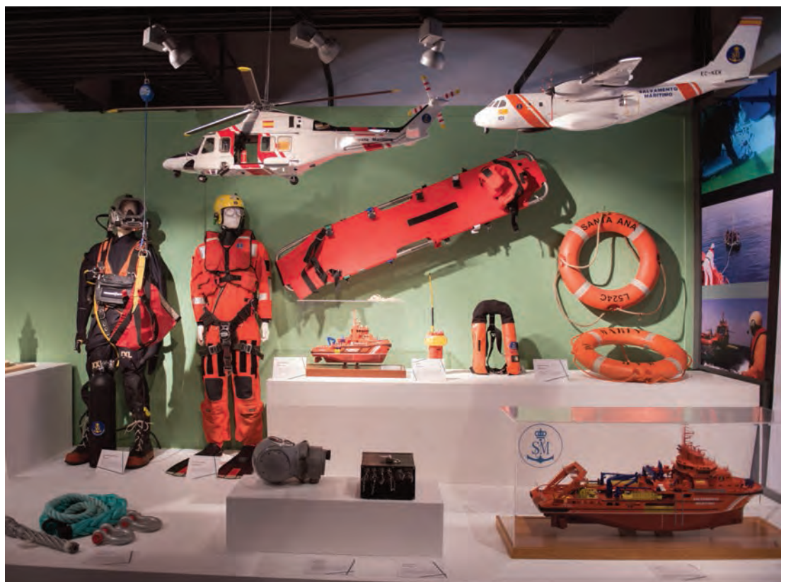
▶ Maquetas, equipos y medios de SASEMAR