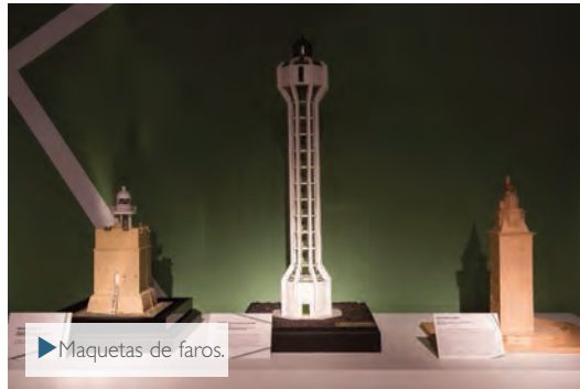
▶ Maquetas de faros.