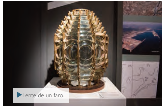
▶ Lente de un faro.

de Ayudas al Alquiler y las incluidas en el Plan de Vivienda 2005-2008, aprobando asimismo a finales del año 2007 una Renta Básica de Emancipación que tiene por objeto el favorecer el acceso a la vivienda de los segmentos de población más joven.