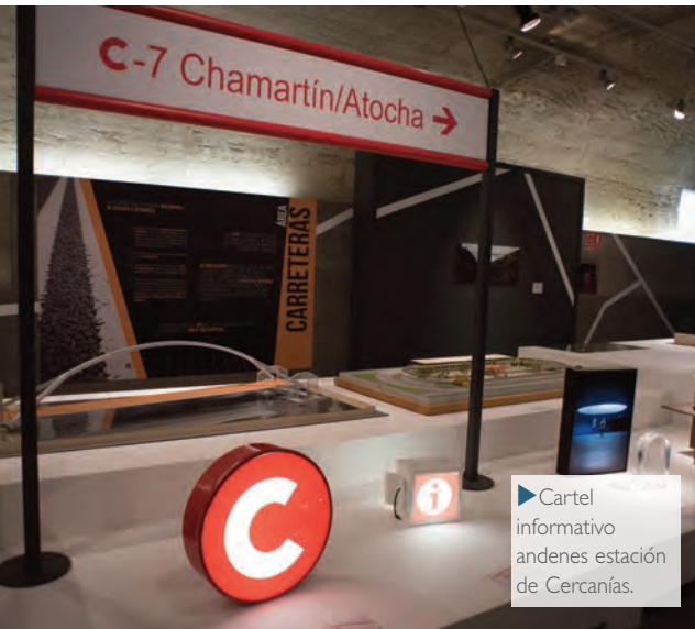
► Cartel informativo andenes estación de Cercanías.

favor de la regeneración urbana integrada y del trabajo conjunto de todos los Estados miembros por conseguir una Agenda urbana para Europa. También, en los años 2007 y 2010 se aprueba la normativa básica estatal que garantiza la accesibilidad universal a los edificios y a los espacios públicos urbanizados, en condiciones de igualdad en todo el territorio nacional.