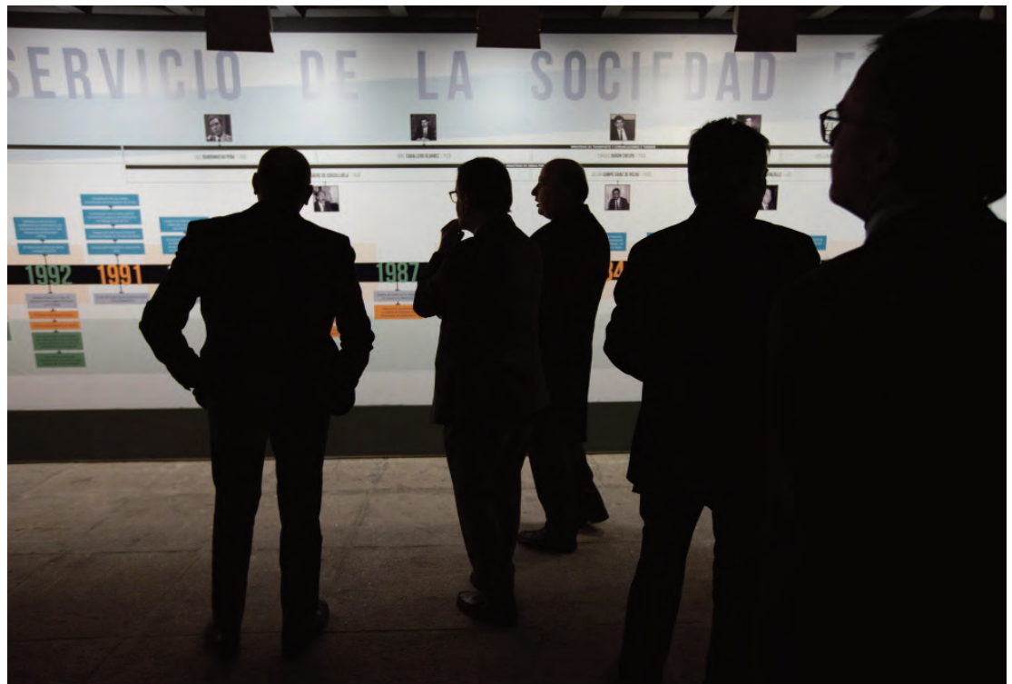
▶ Visitantes en la exposición