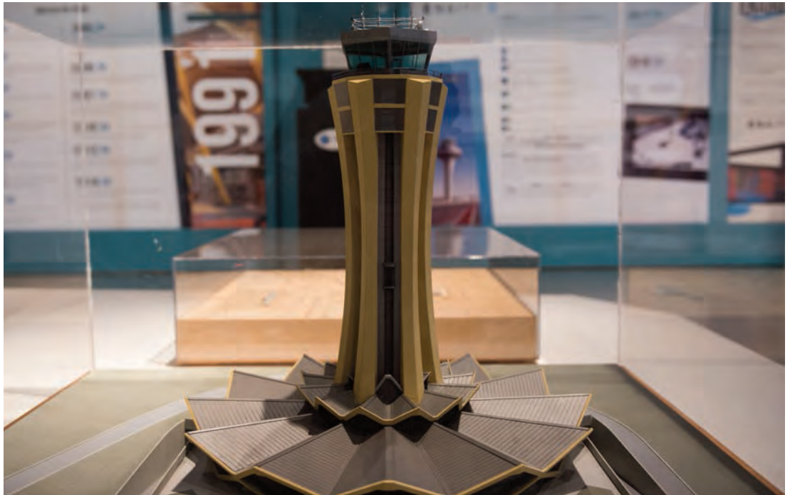
► Maqueta de la torre de control del aeropuerto de Málaga.

Al IGN compete asimismo la gestión de la Red Sísmica Nacional, el Centro Nacional de Alerta de Tsunamis y de la Red de Vigilancia Volcánica.