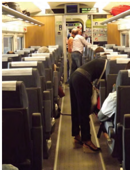
► El ferrocarril transportó 603 millones de personas en 2017.