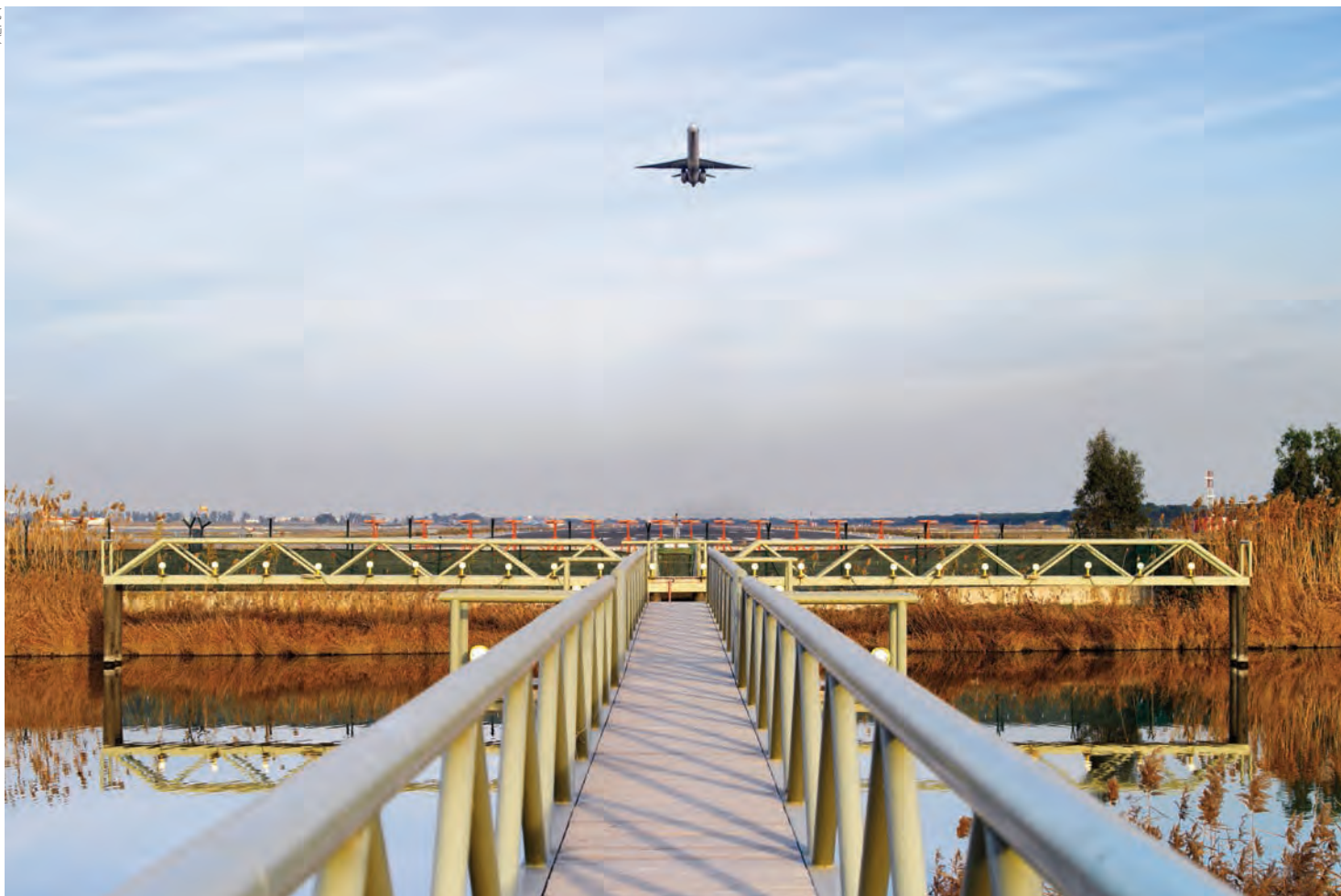
► Corredor litoral junto al aeropuerto de Barcelona-El Prat.

cabe destacar especialmente la incorporación de nuevos contenidos. En concreto, los capítulos relativos a transporte de mercancías por carretera, transporte ferroviario de mercancías y transporte aéreo se han ampliado con nueva información que permite completar y dar más nitidez a la radiografía general del transporte en nuestro país.