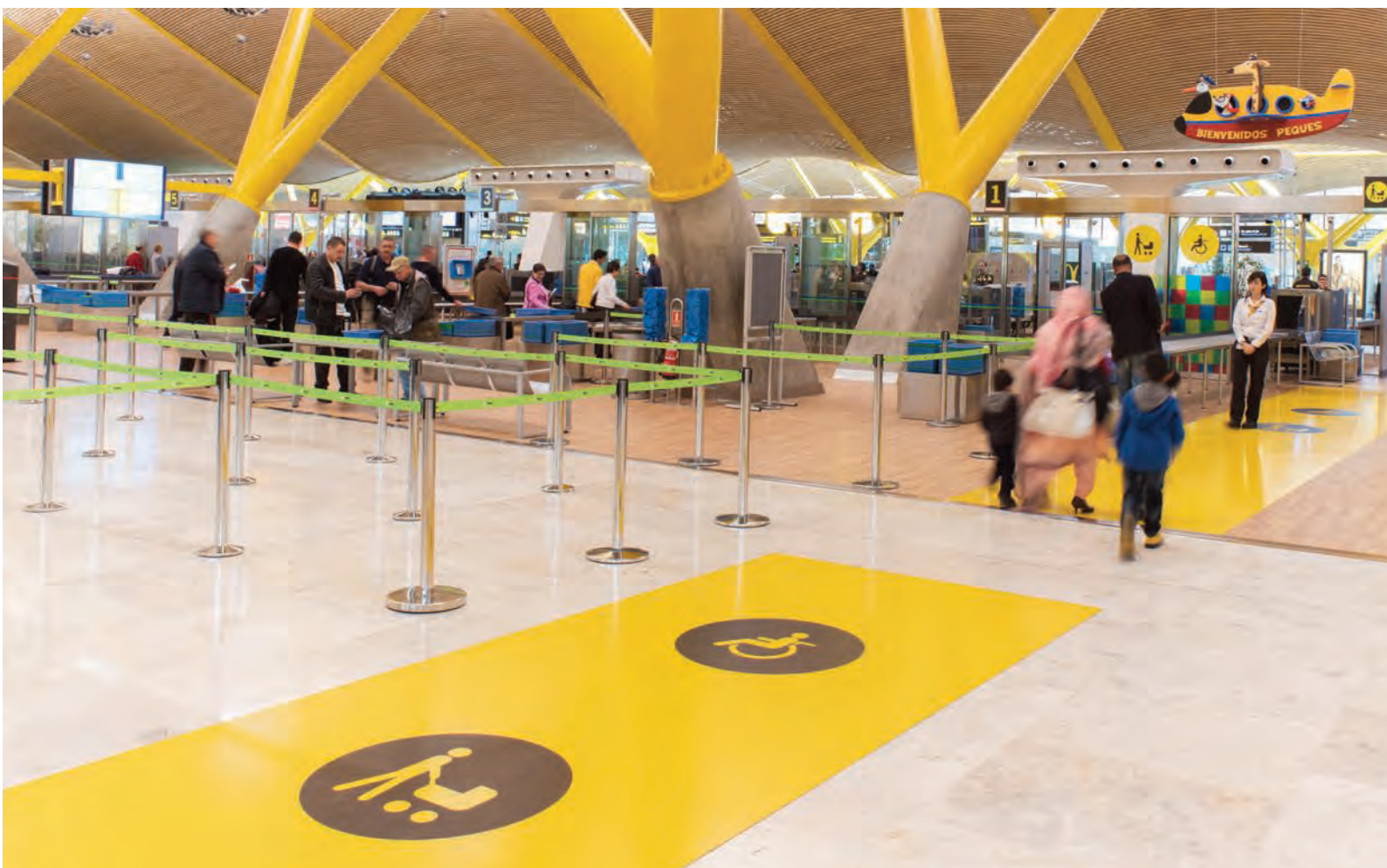
► Accesos para personas con movilidad reducida en el control de seguridad del aeropuerto Adolfo Suárez Madrid-Barajas.

Sobre la inversión en I+D+i, el Informe señala que en 2017 se repitió el incremento ya iniciado en 2016, con un 21% más y alcanzando un total de 69 millones de euros, cantidades que aún se encuentran lejos de niveles anteriores a la crisis. Dentro de este capítulo, el Informe repasa en un detalle muy singular, como es el de la gran eficacia de las inversiones, pues las patentes solicitadas por euro invertido en el sector del transporte están muy por encima de la media del conjunto de la economía, siendo de 131 en 2017, cifra que aún está lejos del máximo de 253 patentes conseguido en 2013.