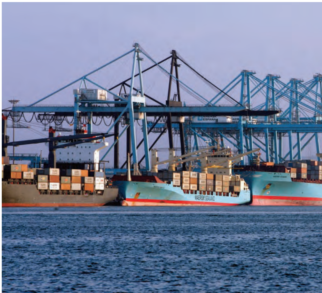
► En 2017, la carga en contenedores supuso más del 33% de la mercancía total en la Red de Puertos.

transporte y almacenamiento, evolución de precios y costes, I+D+i, seguridad y sostenibilidad ambiental.