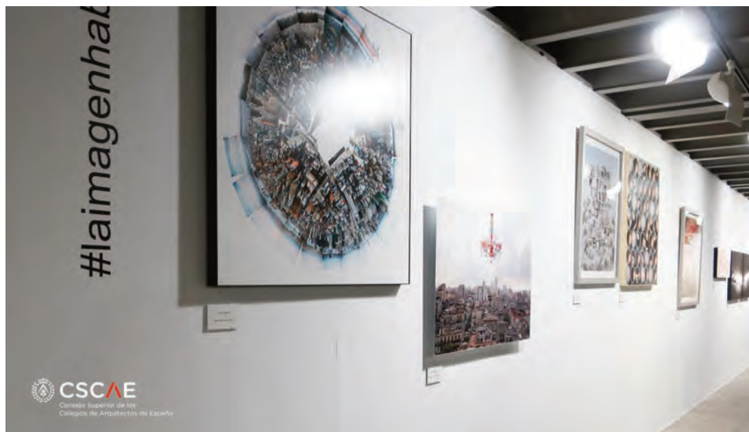
► Fotografías con las obras premiadas.