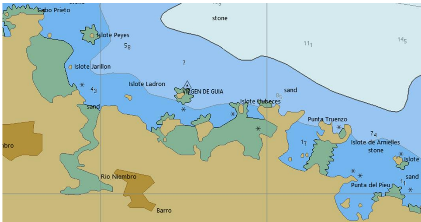
Figura 4. Zona del accidente

El relato de los acontecimientos se ha realizado a partir de los datos, declaraciones e informes disponibles. Las horas referidas son locales.