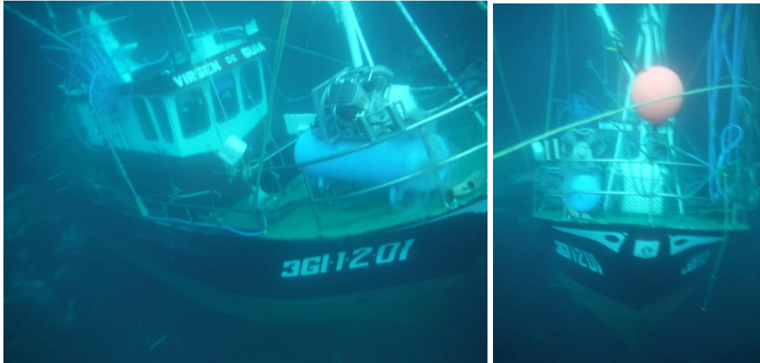
Figura 6. Imágenes de la inspección submarina de la E/P VIRGEN DE GUIA

El reflotamiento se realizó el día 11 de agosto de 2021, tras la aprobación del estudio de reflotamiento por parte de la Capitanía Marítima de Gijón.