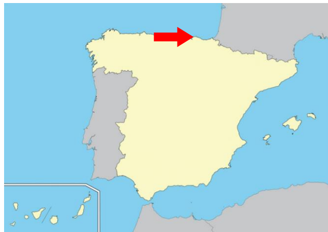
Figura 2. Lugar del accidente