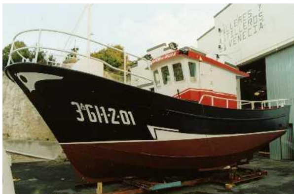
Figura 1. E/P 1 VIRGEN DE GUIA