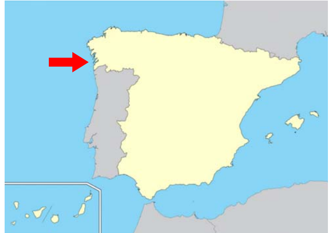
Figura 2. Lugar del accidente