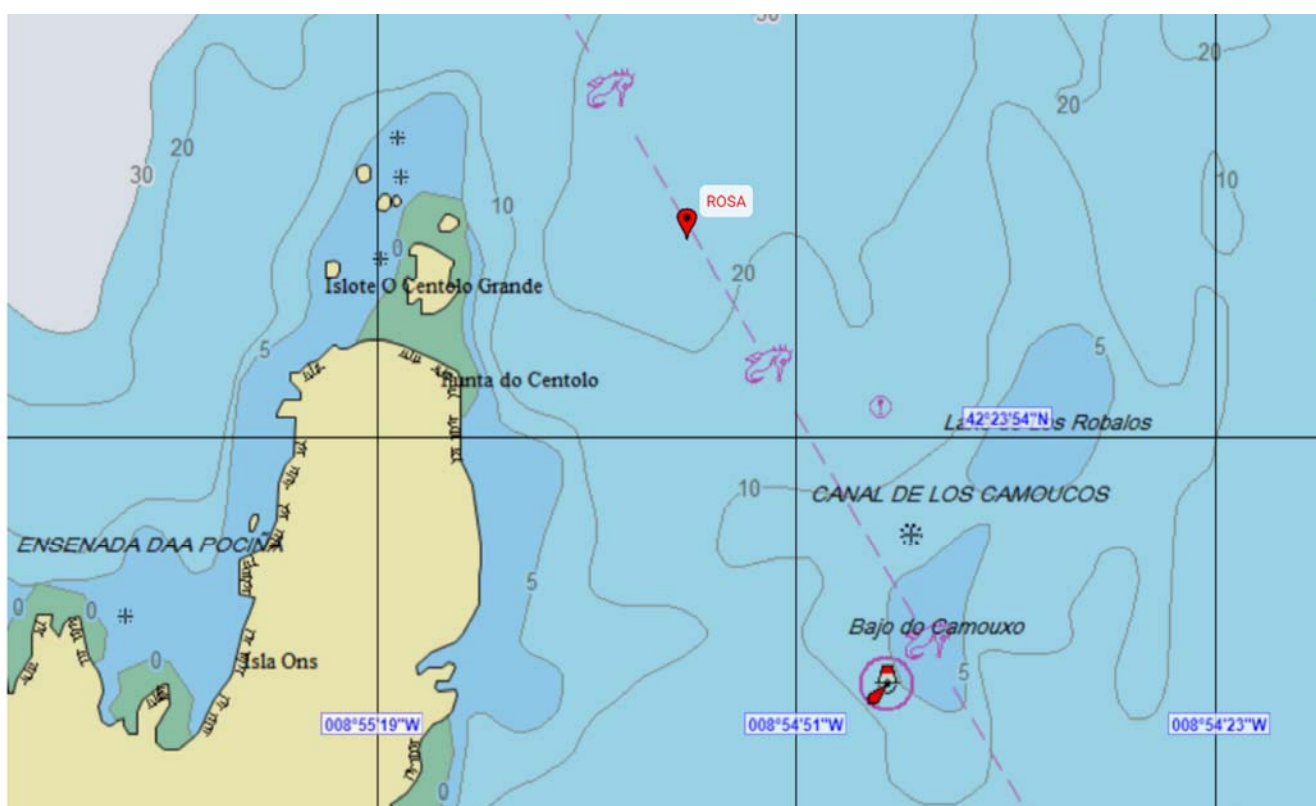
Figura 3. Zona del accidente

El relato de los acontecimientos se ha realizado a partir de los datos, declaraciones e informes disponibles. Las horas referidas son locales.