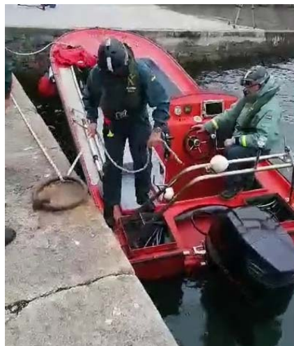
Figura 6. E/P ROSA en puerto tras ser recuperada