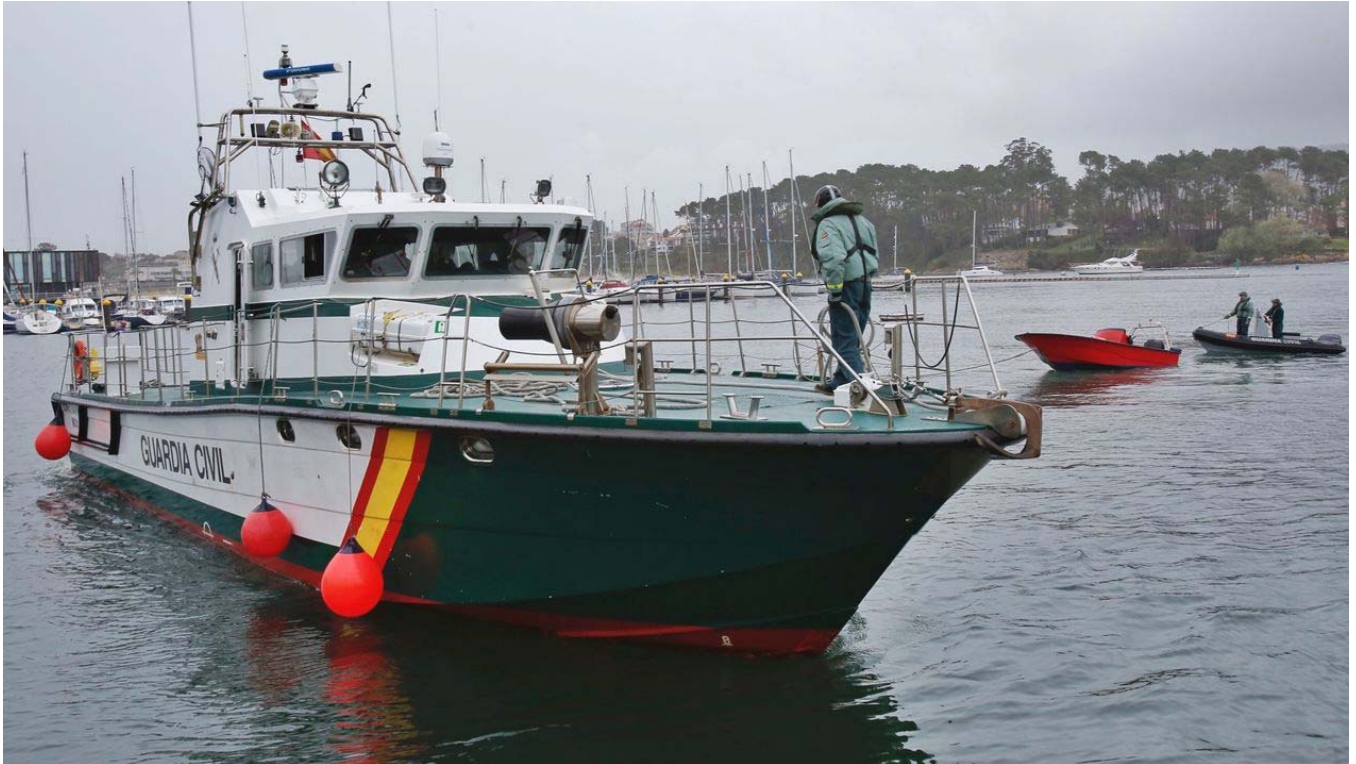
Figura 8. E/P ROSA durante su remolque