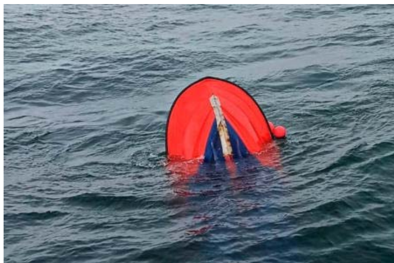
Figura 5. E/P ROSA semihundida tras el accidente