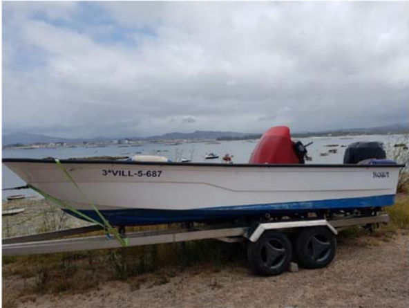
Figura 1. Embarcación ROSA

Vuelco del pesquero ROSA cerca de la isla de Ons (Pontevedra), el 11 de febrero de 2020, resultando un tripulante fallecido