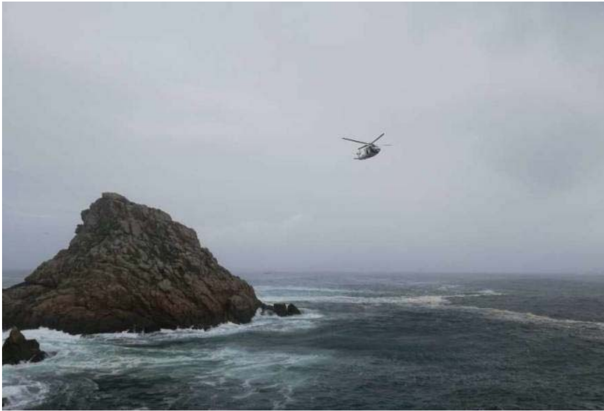
Figura 4. H/S PESCA I durante la búsqueda en el Islote O Centolo Grande

y buceadores locales, el cual finaliza 3 días después, el 14 de febrero de 2020, a las 13:30 horas, cuando buceadores locales localizan la ubicación del cuerpo del marinero desaparecido.