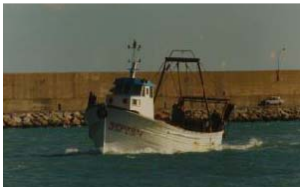
Figura 1. Pesquero ROSA