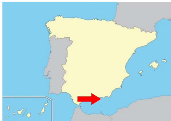
Figura 2. Zona del accidente