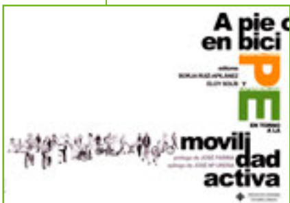
Borja Ruiz-Apilánez y Eloy Solós (edit.)