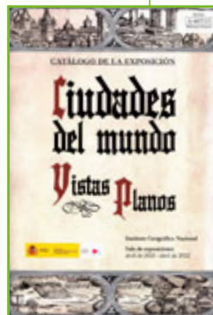
Catálogo de la exposición del mismo nombre organizada por el Instituto Geográfico Nacional de abril 2021 a abril 2022

Este catálogo de la exposición que lleva su nombre tiene como fin la difusión de los contenidos de la misma, de gran interés para el lector puesto que muestra, desde un punto de vista cronológico, la evolución de la imagen impresa de las ciudades teniendo en cuenta, no solo los cambios en la tipografía, sino también en las técnicas de representación. Se inicia el recorrido con la Geographia de Ptolomeo, para seguir con los mapamundis medievales de los siglos VII al XV, y continuar con el Civitas Orbis Terrarum , del siglo XVI, el primer atlas de ciudades de la Historia. Los grandes descubrimientos geográficos dieron lugar a nuevas representaciones urbanas para satisfacer así la curiosidad por los nuevos mundos y de esta manera, pasando por los grabados en cobre o las litografías, el recorrido llega hasta el siglo XIX.