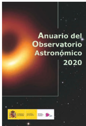
Portada de la edición del Anuario del Observatorio Astronómico de Madrid para 2020.

El Observatorio Astronómico Nacional viene publicando, cada año desde 1860, un excelente Anuario Astronómico. Este libro contiene las efemérides de los astros del sistema solar, las explicaciones de cómo hacer uso de tales efemérides y