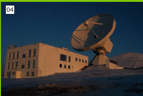
01. El Real Observatorio de Madrid antes de la invasión napoleónica. | Dibujo de Isidro González Velázquez.