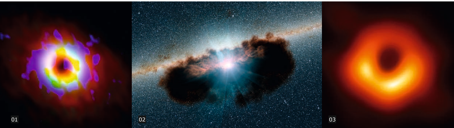
01. Disco proto-planetario de la estrella AB Auriga observado en distintas longitudes de onda de radio con el interferómetro NOEMA de IRAM por un equipo del OAN. Cada color traza la emisión de una molécula distinta. El agujero que se observa cerca de la estrella ha sido creado por un planeta recién formado. | Foto: OAN. 02. Recreación del anillo de gas que rodea al agujero negro que se encuentra en el centro de la galaxia activa NGC 1068 situada a 47 millones de años luz de la Tierra. Esta estructura tiene un diámetro de unos 60 años luz y ha sido estudiada con el interferómetro ALMA por un equipo del OAN. | Foto: OAN. 03. Esta es la primera imagen jamás obtenida de las inmediaciones de un agujero negro supermasivo. Se encuentra en el centro de la galaxia M87, pero se cree que tales agujeros negros deben de estar presentes en todas las galaxias masivas. Personal del OAN y del Observatorio de Yebes participó activamente en la obtención de esta imagen que supuso un hito en astrofísica. | Foto: EHT.

en Plateau de Bure (Alpes franceses), y el interferómetro ALMA en el desierto de Atacama (Chile). El nacimiento y la muerte de las estrellas, la formación de planetas similares a la Tierra, la detección de moléculas prebióticas, la estructura de las estrellas evolucionadas, el estudio de la estructura de las galaxias particularmente activas, etc., son algunos de los temas de estudio que se realizan hoy en el Observatorio. Por otra parte, en estrecha colaboración con los ingenieros e ingenieras del Observatorio de Yebes (IGN), se trabaja en importantes desarrollos técnicos de interés en astronomía y ciencias afines.