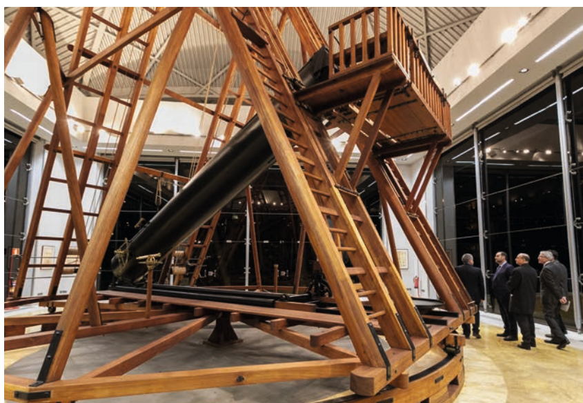
El Ministro José Luis Ábalos frente a la réplica del telescopio de 60 cm de diámetro y 25 pies de distancia focal que William Herschel construyó en 1804 para el Real Observatorio Astronómico de Madrid.

Foucault, y la joya arquitectónica: el edificio de Juan de Villanueva (arquitecto del Museo del Prado). Así, ciencia, historia y arte se interrelacionan en la narración de las visitas guiadas proporcionando una visión amplia y didáctica del Real Observatorio, desde la Ilustración hasta nuestros días. Las visitas guiadas al Real Observatorio están abiertas tanto al público general como a centros educativos. Información y venta de entradas en la web: http://www.ign.es/rom/visitas/index.html