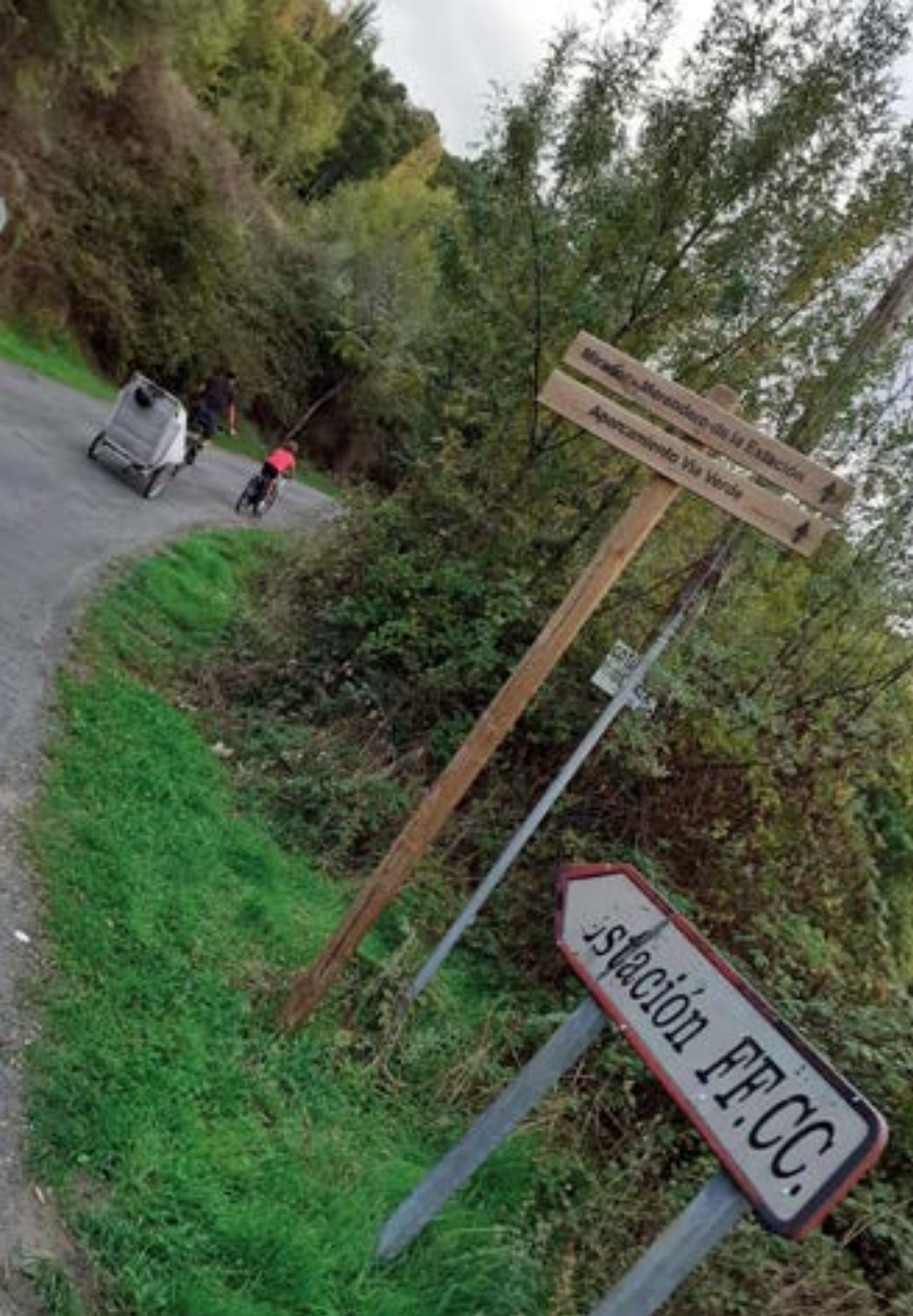
Vía Verde próxima a una estación de ferrocarril.

La apuesta por el desarrollo de un plan o de un programa sectorial de cicloturismo contribuirá a generar más empleo, vertebrará el territorio dotando de una mayor accesibilidad con nuevos itinerarios o rutas y estimulará una economía rural, sostenible y de escala.