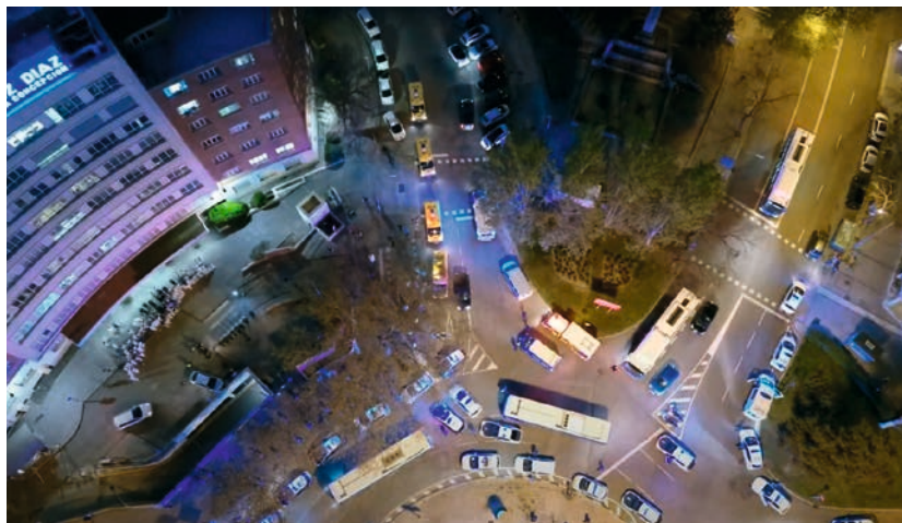
Foto aérea con dron de la Policía Municipal de Madrid sobre Fundación Jiménez Díaz Madrid.

En Illes Balears, operación de RPAS por parte de la policía municipal de Santa Eularia des Riu, en Ibiza, coordinada con el centro de control de ENAIRE en Palma.