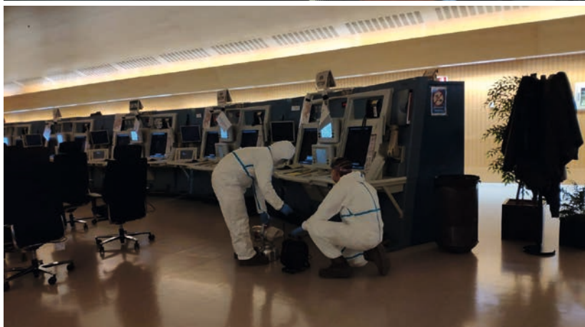
De arriba abajo, la UME en el centro de control de ENAIRE en Sevilla, en la torre de control del Aeropuerto de Tenerife Sur, y en el centro de control de ENAIRE en Barcelona.