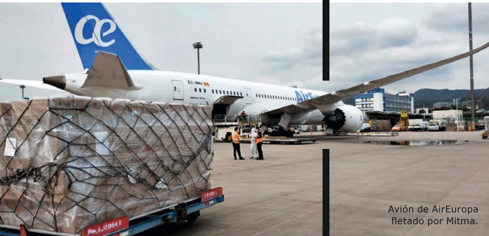
Avión de AirEuropa fletado por Mitma.

Los controladores aéreos de ENAIRE dieron prioridad a los puentes aéreos de suministros con lo necesario para combatir la pandemia