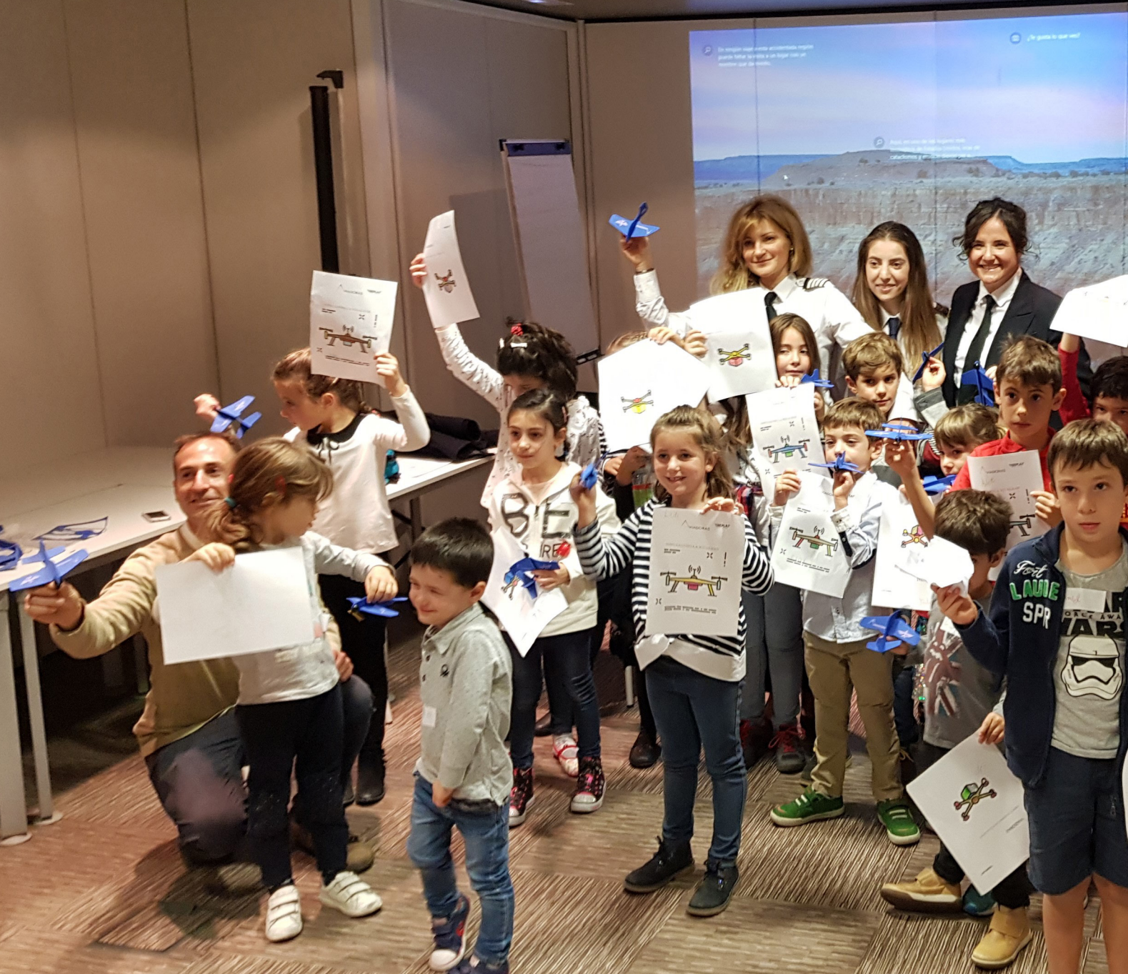
Jornadas Aeronáuticas en "Días Sin Cole", que facilitan la conciliación