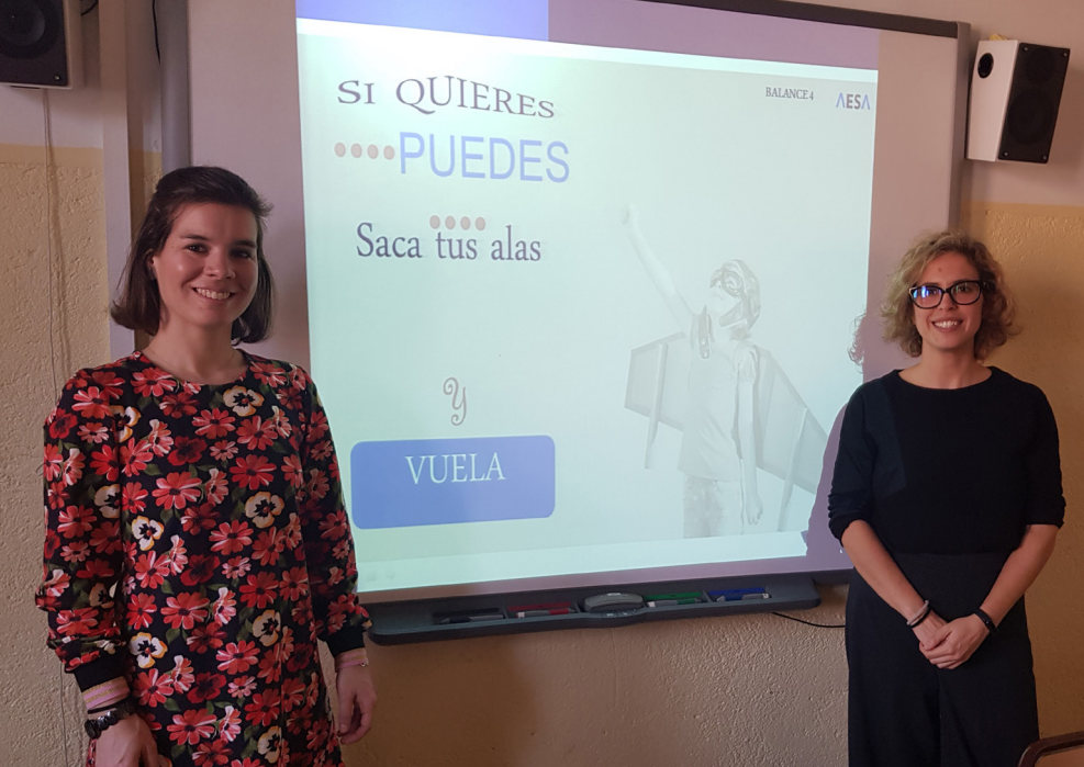
Equipo de Balance 4 AESA en jornada de divulgación aeronáutica.

importando las mejores prácticas tanto a nivel nacional como internacional, con el objetivo de promover la igualdad de género y el empoderamiento de las mujeres en el sector de la aviación mundial.