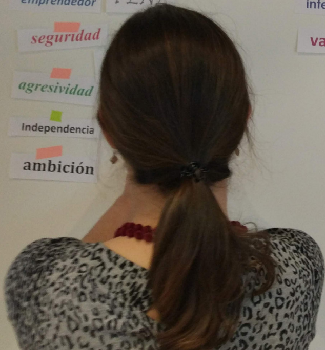
Formación en habilidades del programa Go4it de Balance 4 AESA.

de las y los trabajadores, identificando los principales "gaps" para la realización laboral y personal, lo que permite trabajar para eliminarlos. Al tiempo que se incentiva a las y los participantes a realizar su "Plan de Acción" personal, para conseguir alcanzar sus retos y aspiraciones individuales y también dentro de la organización.