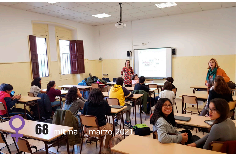
Balance 4 AESA trabaja por acabar con estereotipos en los colegios.

El programa de Mentoring, es una de las líneas estratégicas de trabajo para incrementar la participación de las mujeres y lograr una mayor igualdad de sexos en los puestos de liderazgo, una de las mejores formas de mejorar la producción y la eficiencia. A través de él, se están conociendo las necesidades y motivaciones