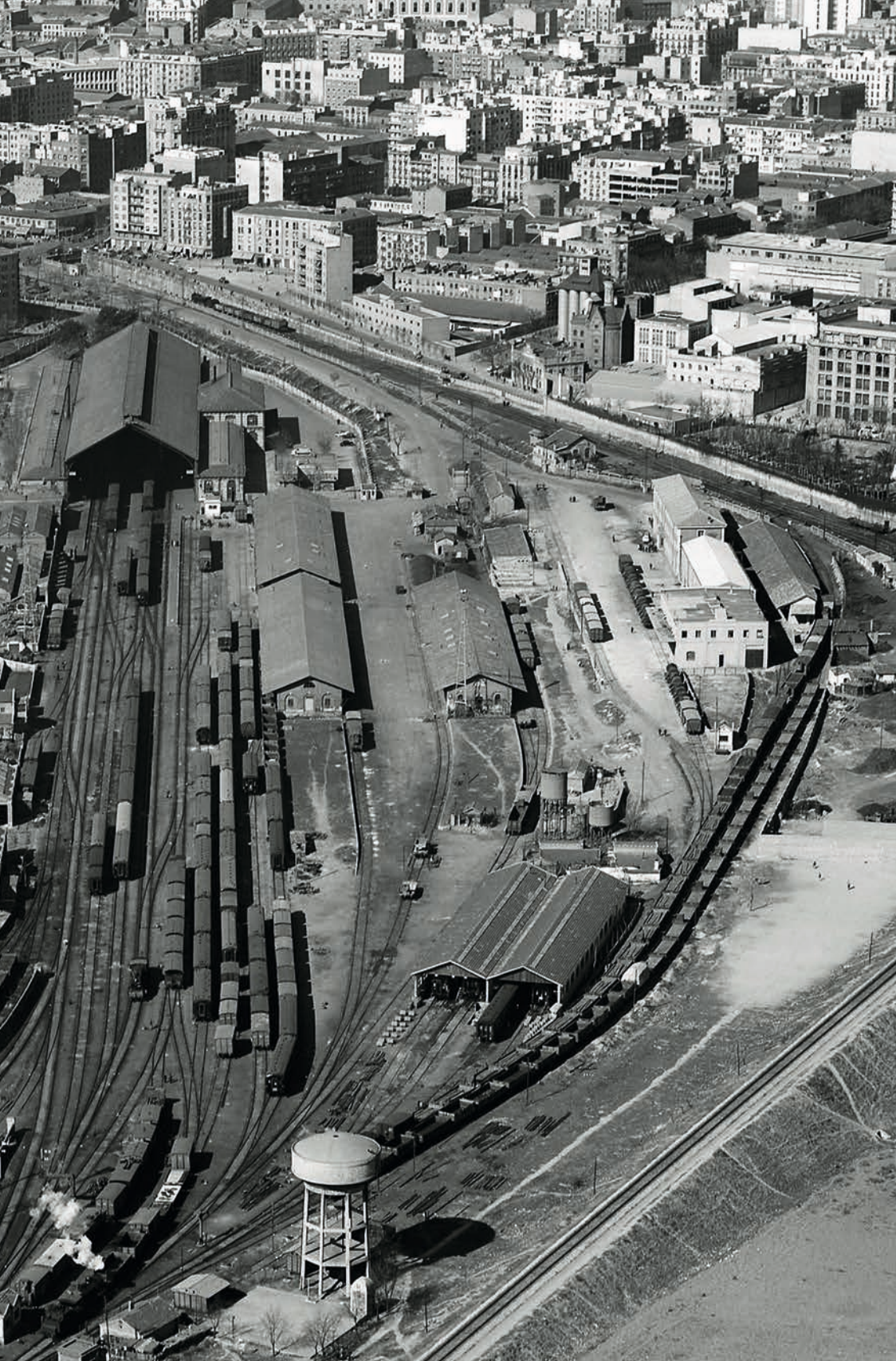
Vista aérea de la estación de Madrid-Delicias en 1961.