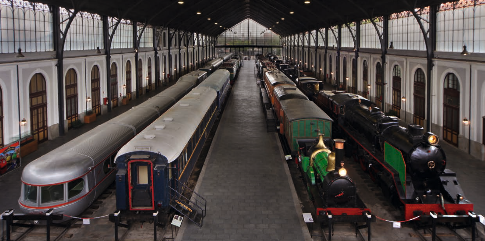
Sala de Tracción del Museo del Ferrocarril de Madrid.

de adecentamiento del recinto exterior y de algunas dependencias internas, como el vestíbulo, que se embelleció con una nueva decoración azulejada. El cambio más llamativo se produjo a comienzos de la década de 1950, con la apertura de un acceso directo a la nave central en el frontis del edificio, adonde fue trasladada la marquesina del antiguo pabellón de Llegadas, siendo hoy en día el acceso principal al Museo.