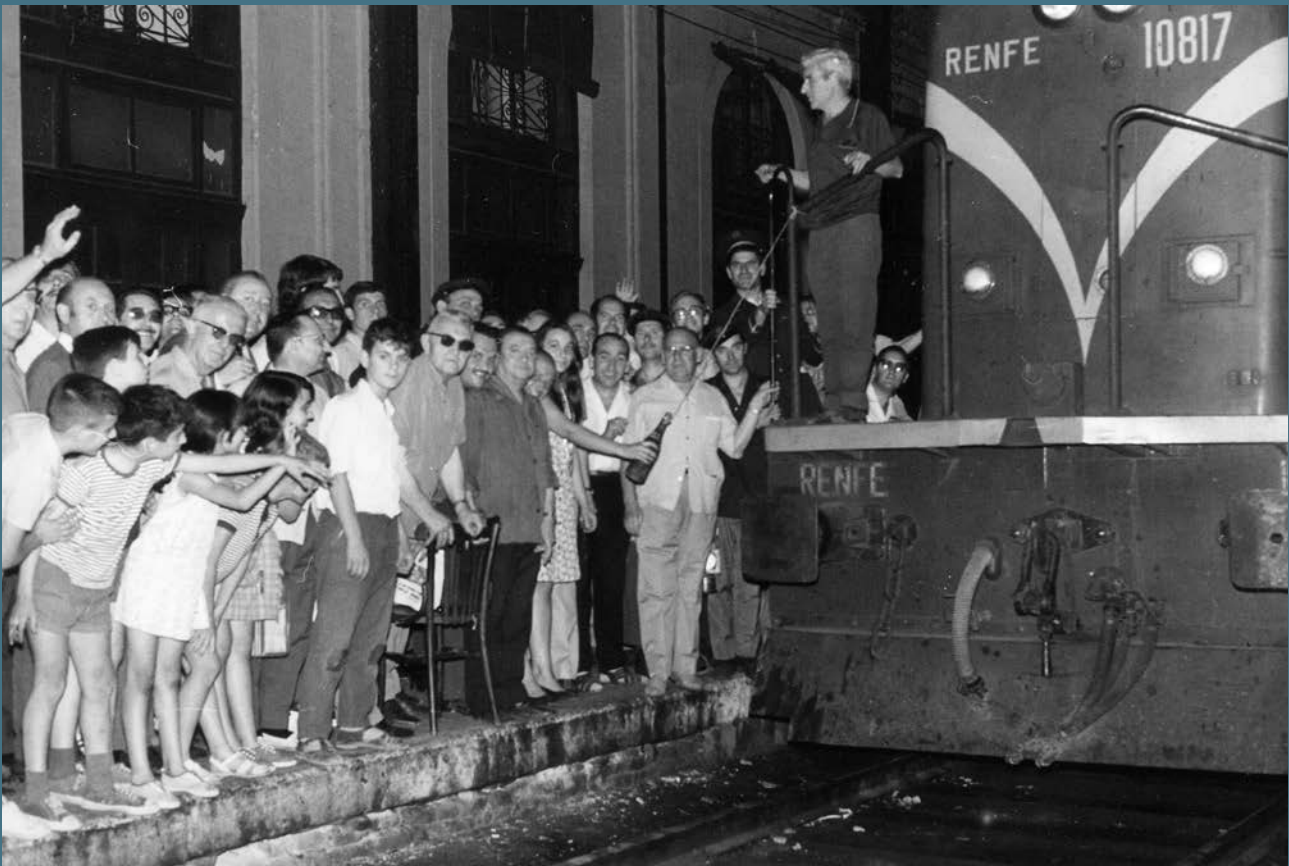
El expreso de Badajoz, último tren que salió de Delicias. 30-jun-1969.

denominada, estación de Ciudad Real. Como colofón, varias citas literarias, extraídas de algunas obras en las que Delicias aparece mencionada, concluyen esta muestra conmemorativa.