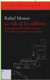
Edita: Acantilado Autor: Rafael Moneo

A través de tres artículos escritos en distintas épocas y circunstancias, Rafael Moneo nos acerca a la arquitectura invitándonos a observar con una nueva mirada dos edificios tan conocidos como la mezquita de Córdoba y la lonja de Sevilla, y a descubrir otro más reciente y secreto: el carmen de Rodríguez-Acosta en Granada. Sobre sus edificios –señala el reconocido arquitecto- gravita el tiempo (...) estamos obligados a aceptar que sus vidas implican continuo cambio (...) Al mismo tiempo la vida de los edificios está soportada por su arquitectura, por la permanencia de sus rasgos más característicos y, aunque parezca una paradoja, es tal permanencia la que permite apreciar los cambios. Un revelador e instructivo acercamiento a la historia y la geografía de nuestro país de la mano de uno de los arquitectos contemporáneos que mejor ha sabido hacer dialogar pasado y presente.