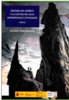
Edita: Mitma y Cedex Autor: José Juan Ojeda Quintana

Obra compuesta de dos tomos (I y II), en ella se describen los estados físicos del agua: líquido (lluvia), sólido (nieve, hielo) y gaseoso (nubes, niebla, etc.), sus convergencias con los mitos religiosos, desde Mesopotamia, Egipto, Grecia y Roma, hasta el momento actual, en el que del mito clásico se pasa a los avances técnicos de aducción, utilización, en el giro de la rueda del eterno retorno, puesto que el agua fluye (Heráclito) pero sigue manteniéndose siempre en la misma cantidad.