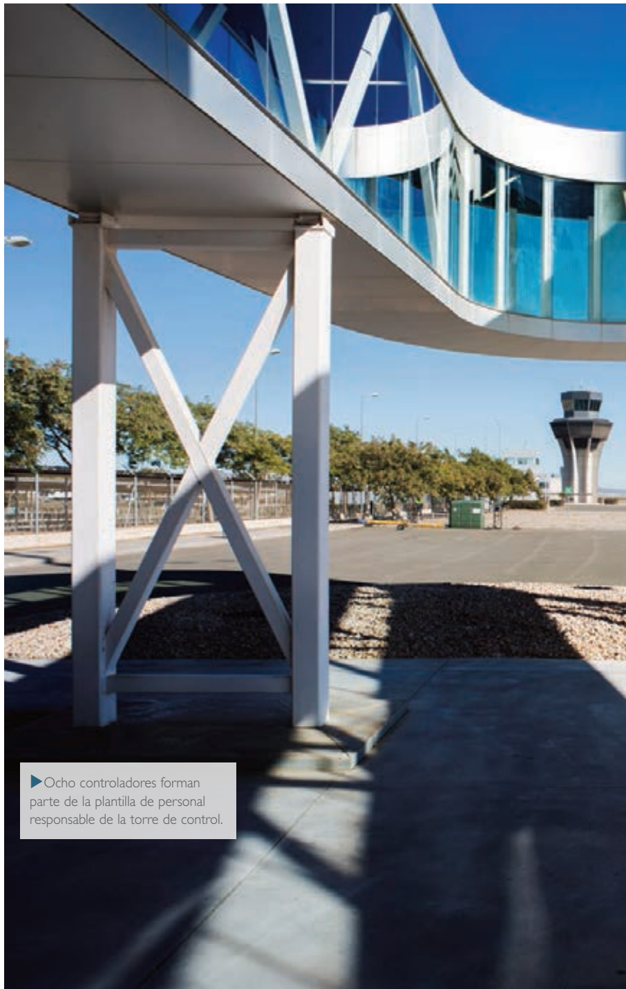
► Ocho controladores forman parte de la plantilla de personal responsable de la torre de control.

La terminal del nuevo aeródromo de Murcia destaca por su luminosidad. Ofrece más de 37.000 m 2 de superficie y consta de dos grandes vestíbulos: