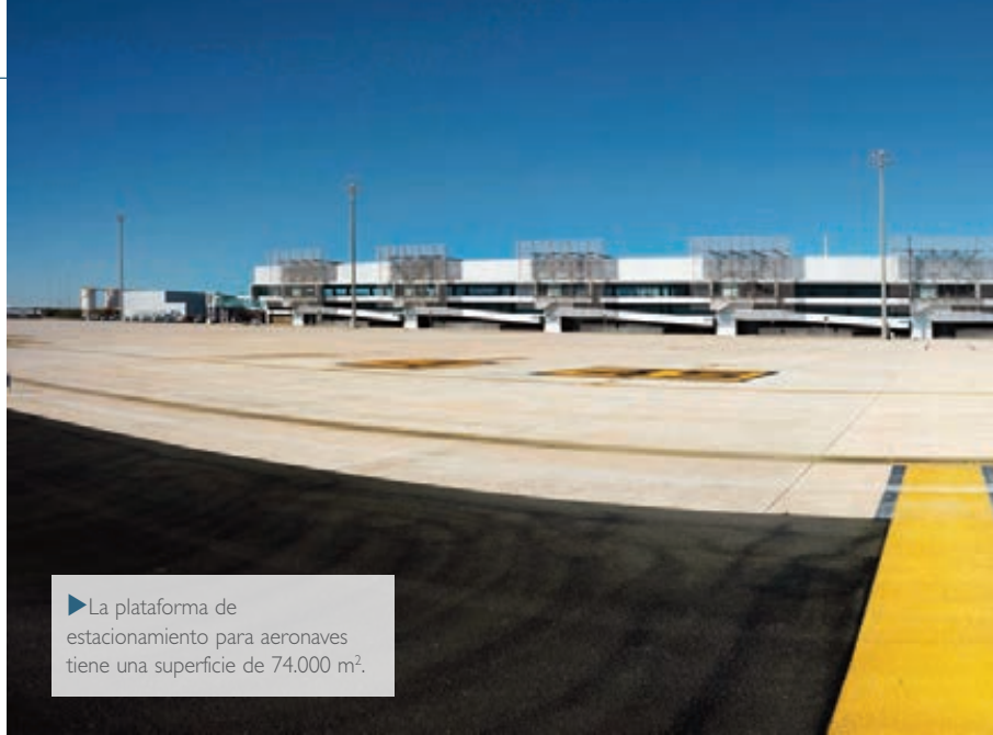
► La plataforma de estacionamiento para aeronaves tiene una superficie de 74.000 m 2 .

El nuevo Aeropuerto Internacional Región de Murcia (AIRM), uno de los principales dinamizadores de la economía regional y un elemento clave para mejorar su conectividad, comienza sus actividades con una clara vocación internacional. Inicialmente son tres los países con conexión con el aeródromo murciano: Reino Unido, Bélgica e Irlanda.