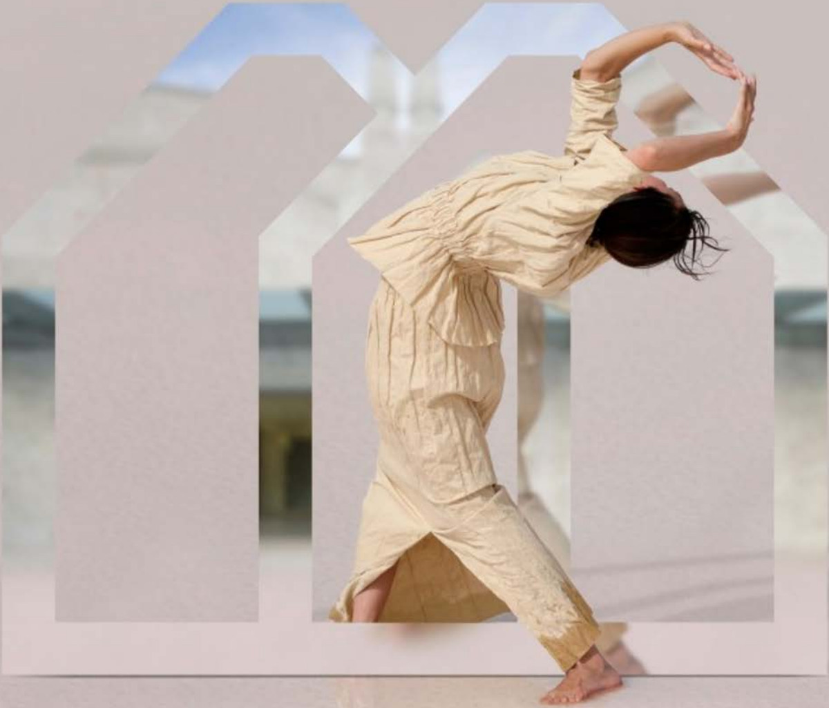
● Texto: Antonio Casares García