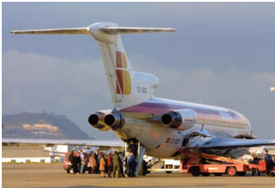
► Pasajeros embarcando en un avión de Iberia.

de los productos más adecuados para competir en los segmentos en los que se espera competencia. En mercancías, actividad que ya opera en competencia, señaló que Renfe debe mejorar la gestión para pasar de ser un mero transportista a un operador logístico internacional. Finalmente, anunció un plan estratégico en 2020 para que Renfe “acometa su puesta al día para el siglo XXI” en materias como mejora de procesos internos, transformación digital y cambio cultural hacia una empresa pública dinámica y moderna.