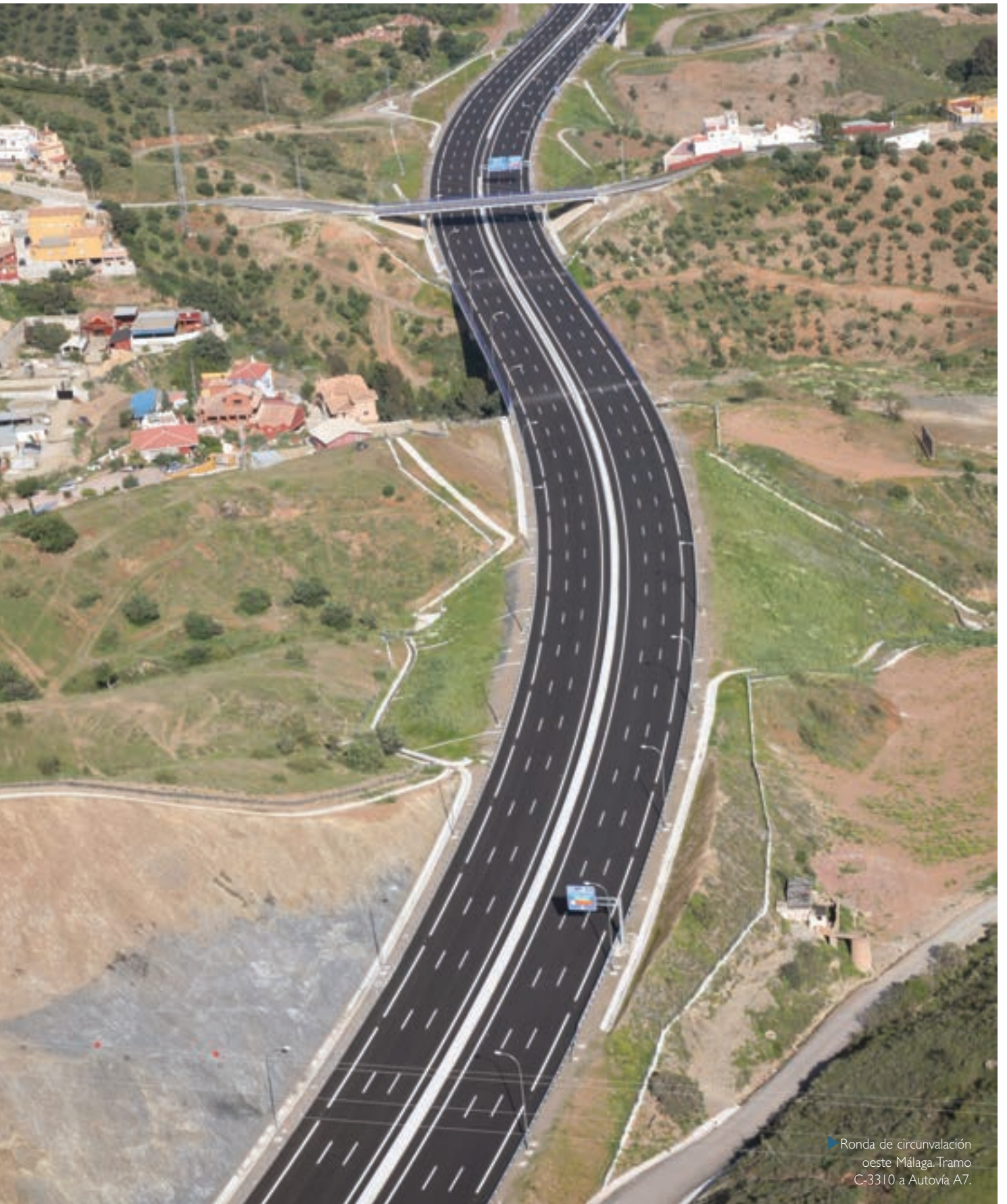
► Ronda de circunvalación oeste Málaga. Tramo C-3310 a Autovía A7.