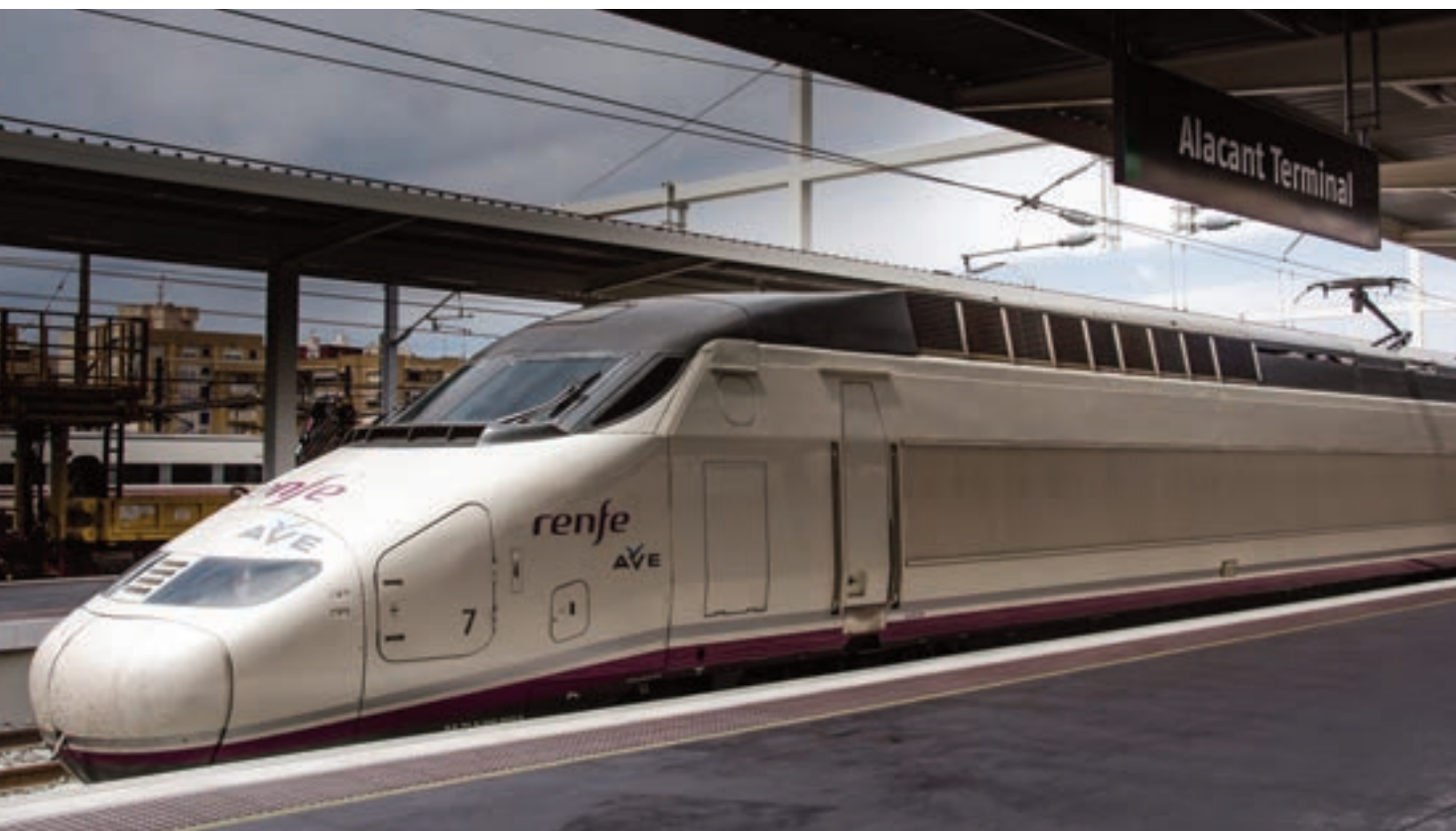
► Tren AVE en la estación de Alicante.

Sagunto-Teruel-Zaragoza, Palencia-Santander, Medina del Campo-Salamanca-Fuentes de Oñoro, Mérida-Puertollano, Grañena-Jaén o Variante de Camarillas). Desde Fomento se impulsarán también los enlaces transfronterizos que faltan para conectar ambas redes a la red transeuropea que se está configurando. Por otro lado, el ministro comunicó que se dará mayor prioridad al segmento de Cercanías, motor de la movilidad metropolitana española al transportar cada día más de millón y medio de pasajeros. Así, dijo que el Departamento dará unidad a los planes anunciados para distintos núcleos de Cercanías (Cataluña, Cantabria, Asturias, Comunidad Valenciana, Comunidad de Madrid) y los integrará en un Plan Nacional de Cercanías de Movilidad Urbana, a elaborar en colaboración con las administraciones.