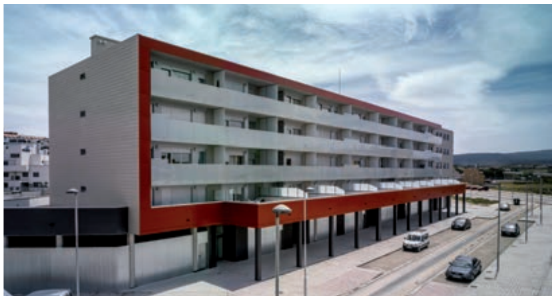
► Edificio de viviendas ecológicas en Teruel.

Junto al capítulo de vivienda social, el ministro desglosó otras medidas que impulsará Fomento en materia de arquitectura, vivienda y suelo y políticas urbanas, y que completan su ámbito de actuación en este campo. Como planteamiento general, manifestó que las políticas urbanas del ministerio se inspiran en los principios de la Declaración de Davos, que pone en valor la calidad del espacio construido como elemento central de las transformaciones urbanas. En este contexto, destacó la puesta en marcha de distintas iniciativas. Para mejorar la sostenibilidad y la habitabilidad en el ámbito del desarrollo urbano y la edificación, adelantó la aprobación e implementación de una Agenda Urbana para España, documento estratégico que buscará la sostenibilidad de las políticas urbanas en su triple dimensión social, económica y ambiental. En edificación, avanzó la definición de nuevas exigencias