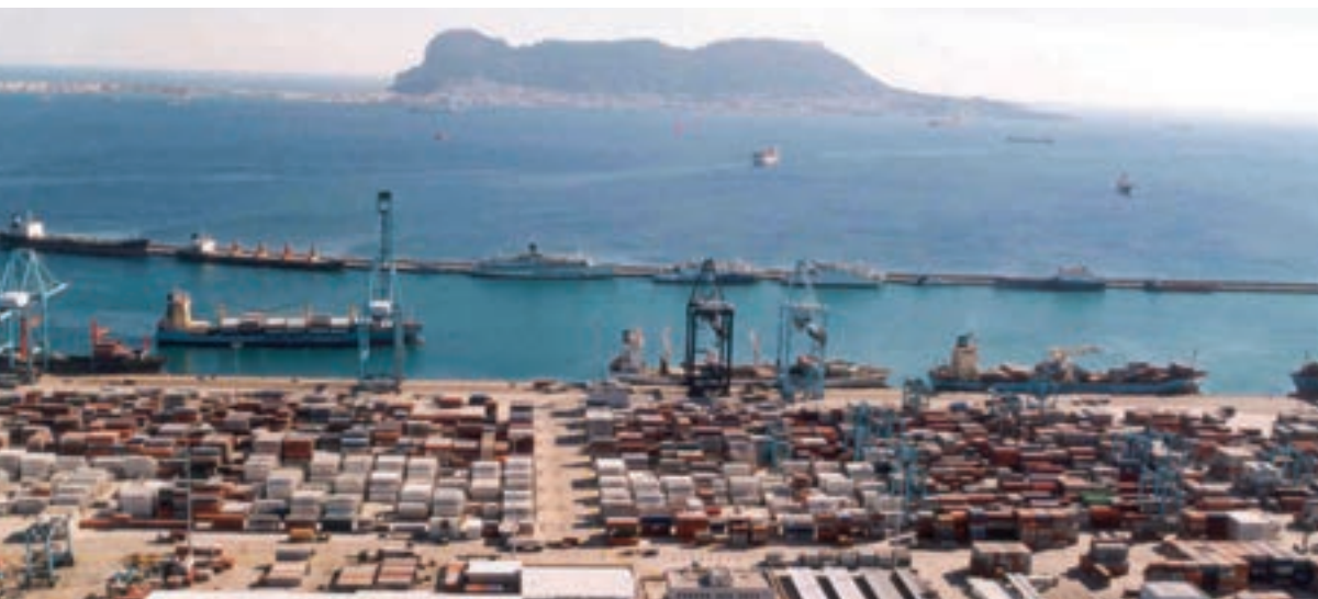
► Puerto de Algeciras, muelle Juan Carlos I.

seguridad, capacidad, sostenibilidad ambiental y eficiencia para afrontar los retos de la navegación aérea española y del Cielo Único Europeo. Según el ministro, las inversiones en los próximos años se centrarán en la evolución de los sistemas y la mejora de la eficiencia y capacidad del espacio aéreo. En 2019, además, se rebajará un 12% la tarifa de ruta, situándola entre las más competitivas de Europa. Y para atajar el déficit de controladores aéreos, se impulsará la oferta para cubrir nuevas plazas.