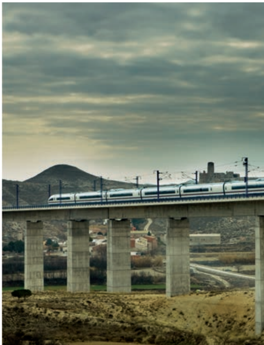
► Tren AVE circulando entre Antequera y Santa Ana, Málaga.

En la parte inicial de su intervención, José Luis Ábalos hizo un diagnóstico general de la situación en materia de infraestructuras, transporte y vivienda, detallando sus luces y sombras. Y trasladó un mensaje de certidumbre al sector al afirmar que en la nueva etapa ministerial habrá, “con carácter general”, una continuidad de los compromisos de inversión y de contratos adquiridos (anunció la licitación de contratos de obra por más de 5.000 M€ hasta final de año). No obstante, precisó que no se debe confundir este mensaje de continuidad en las inversiones “con un aparente inmovilismo ni conformismo”, ya que “queda mucho por hacer”