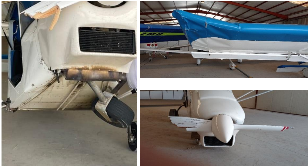
Figura 2. Daños en la aeronave

La punta del plano derecho en la zona del borde de ataque también tocó en el terreno y se deformó ligeramente.