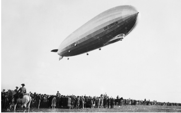
El dirigible alemán LZ127 "Graf Zeppelin" aterrizando en Sevilla en 1930. Fotografía Marín.

Depósito en la Fundación Pablo Iglesias.