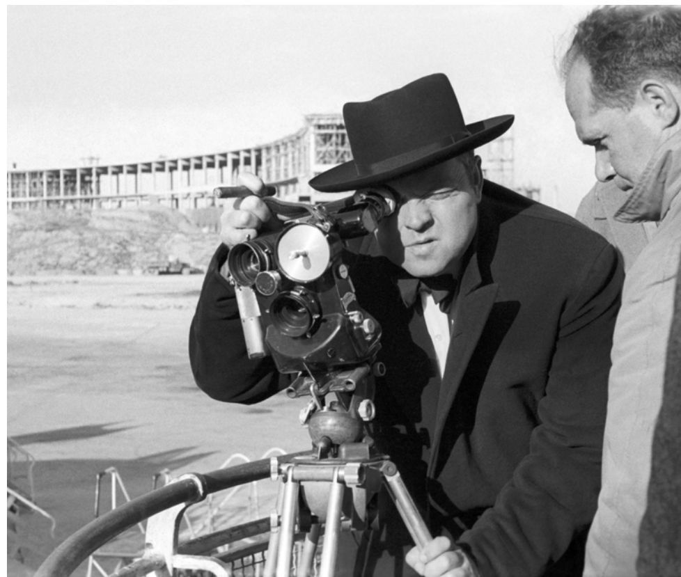
El actor y director Orson Welles durante el rodaje de la película "Mr Arkadin" en el aeropuerto de Barajas. Al fondo, la Terminal 2 en construcción. Madrid, 27 de febrero de 1954.