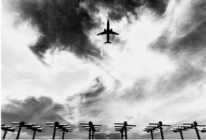
Raúl Urbina Sin título, 2012 Serie Fly me to the moon Impresión digital sobre papel Tecco Pastell Matt Colección del artista