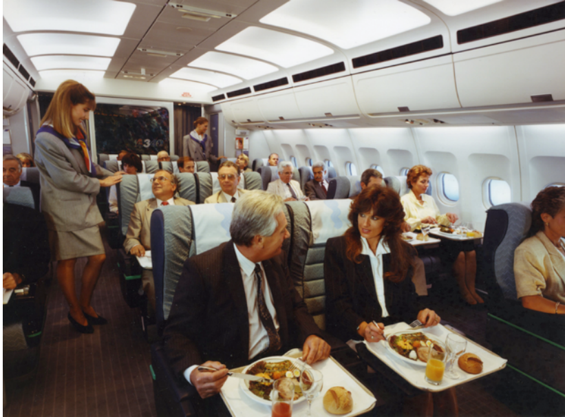
Cabina de pasaje de un Airbus A340.