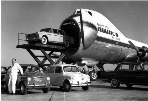
El ATL-98 CARVAIR era un Douglas DC-4 modificado, inicialmente pensado para operar en el Canal de la Mancha entre Francia y el Reino Unido. Su cabina sobrelevada y las dos grandes compuertas de carga en el morro permitían transportar hasta tres turismos y 23 pasajeros. Aviaco operó tres de estos aparatos entre 1964 y 1968 en la línea Barcelona-Palma de Mallorca, permitiendo llegar al viajero a su destino con su propio automóvil.

Depósito en la Fundación Pablo Iglesias.