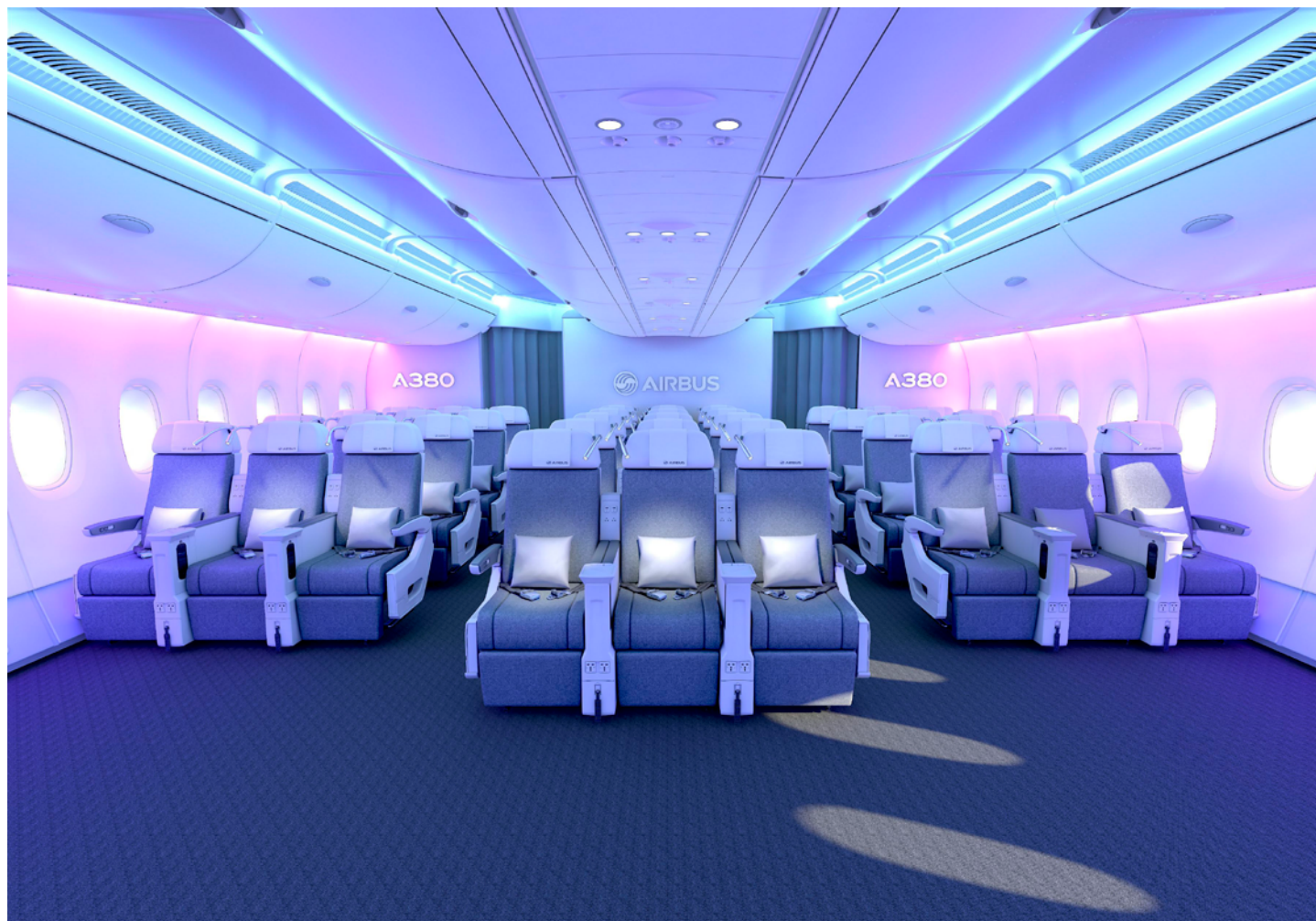
Cabina de pasajeros del Airbus A380.