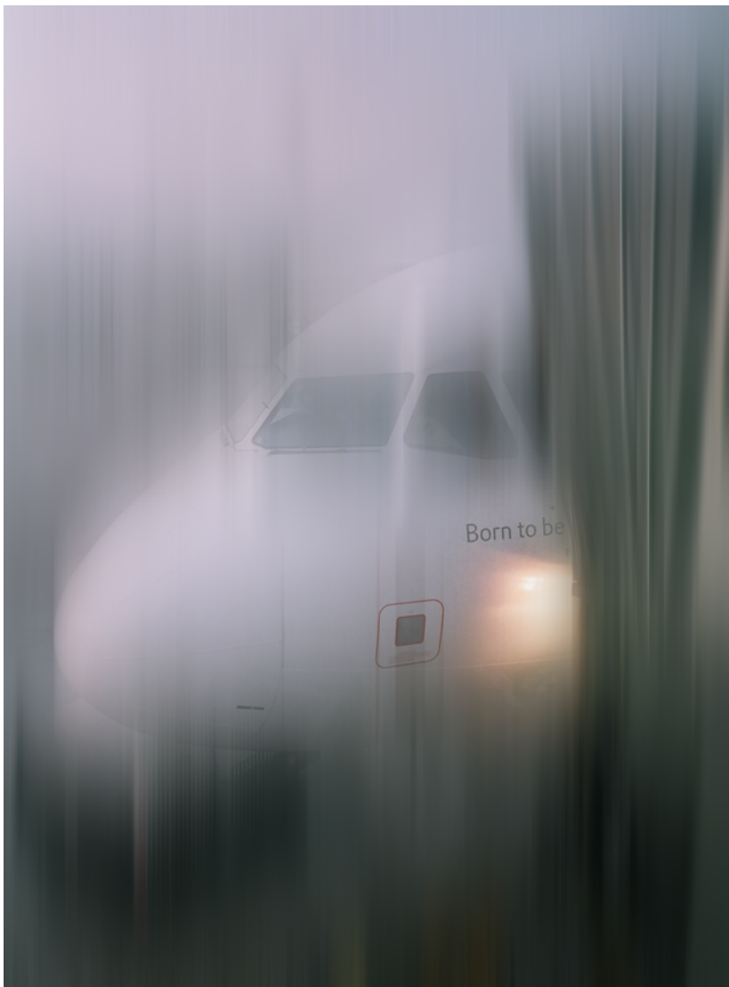
Chema Alvargonzález En el aire VI , 2006. Papel metalizado