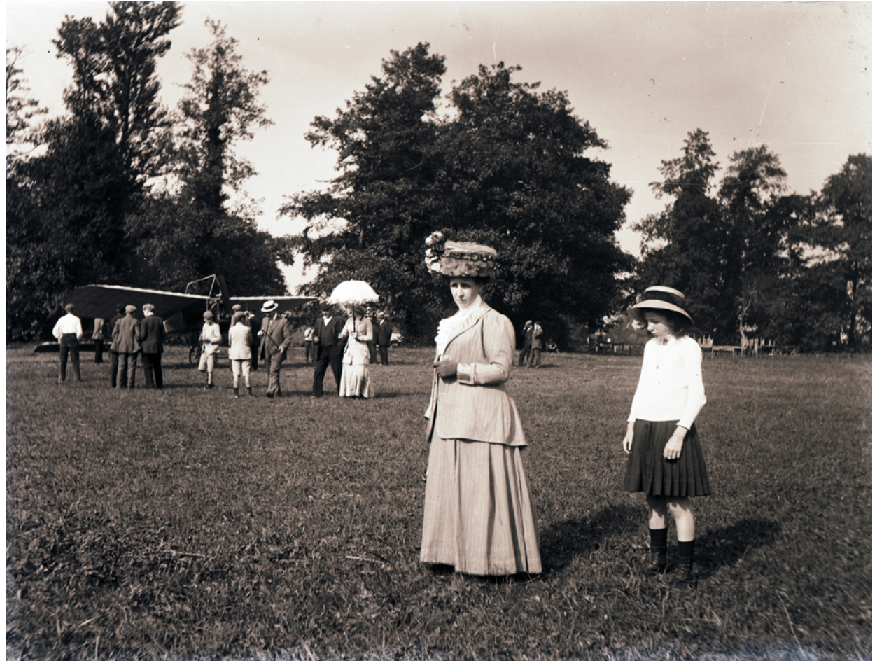
Madre e hija se retratan delante de un Blériot XI tipo "Canal de la Mancha" durante la Semana de la Aviación de Gijón en septiembre de 1910.