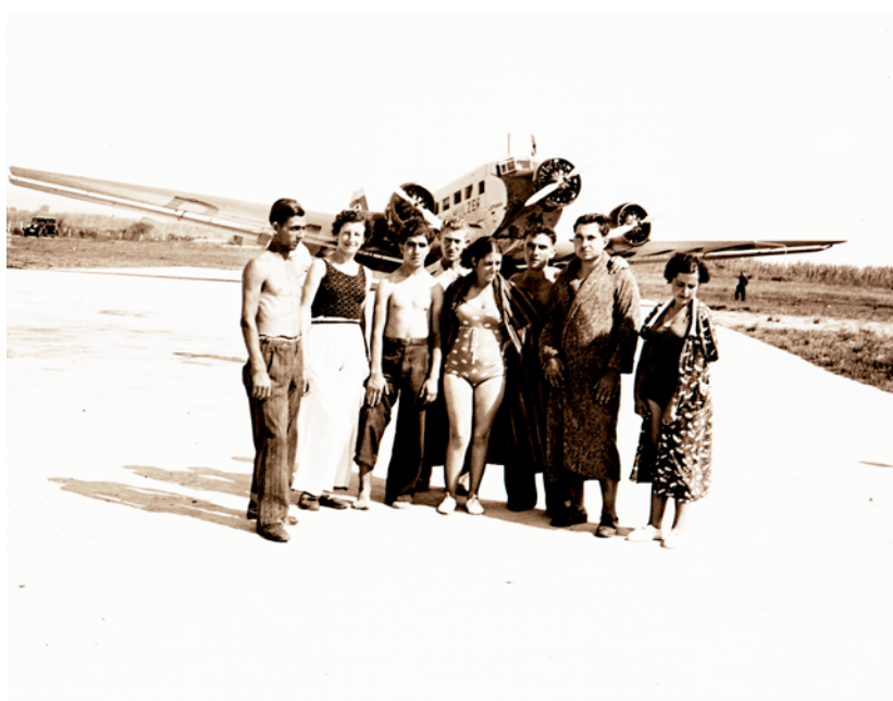
La proximidad de la playa y el delta del Llobregat al aeropuerto de El Prat sin barreras permitía a los bañistas contemplar de cerca los aviones estacionados en la plataforma. En la fotografía, se retratan delante de un Junkers Ju-52 de Lufthansa.

Es la memoria visual de aquellos que pueden compartir la experiencia de los primeros humanos voladores y de sus proezas. Es la experiencia de los pocos afortunados que podían permitirse volar en uno de los primeros aviones de pasajeros. Una experiencia digna de fijarse en el recuerdo y mostrarse, una vivencia memorable para propios y ajenos. Tanto la visión del hombre pájaro como la experiencia aérea se convierten ineludiblemente en motivo para el recuerdo, para la imagen fotográfica. El fotógrafo vernáculo busca la inspiración en el extraño pájaro de madera y tela para componer su obra.