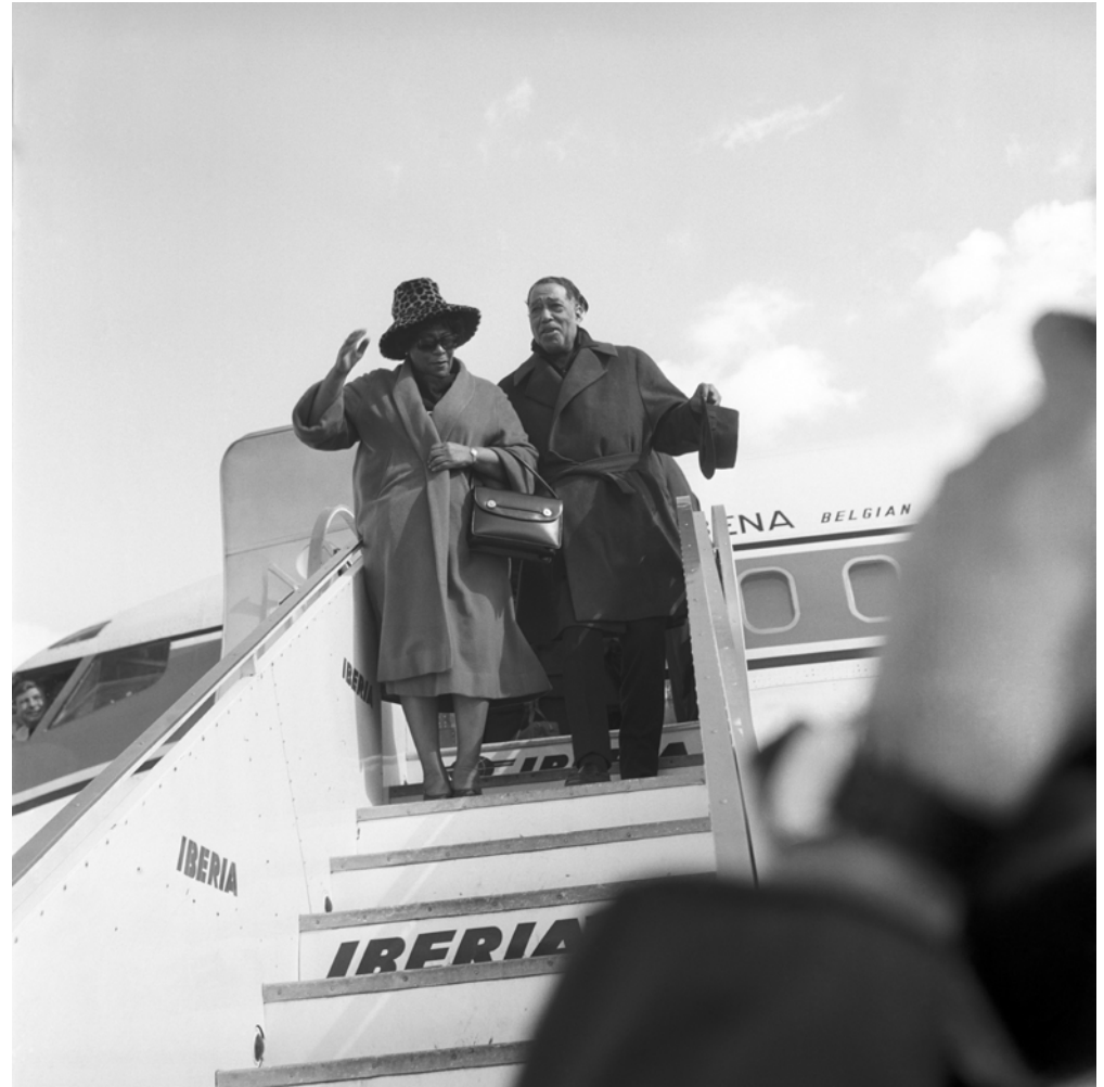
La cantante estadounidense Ella Fitzgerald, acompañada por el pianista Duke Ellington, a su llegada al aeropuerto de Barajas. Madrid, 23 de febrero de 1966.