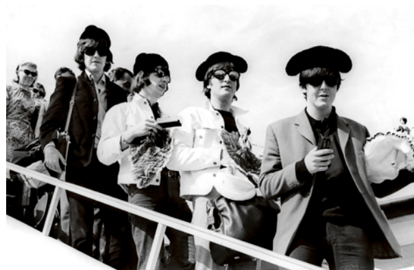
Llegada a El Prat del grupo británico The Beatles, tocados con monteras. Barcelona, 3 de julio de 1965.

Personalidades, actores y actrices, cantantes y famosos sonríen desde las puertas del avión, desde la escalerilla. Las estrellas cinematográficas aterrizan, adquieren materialidad al descender al suelo. Días más tarde, ascienden de nuevo al olimpo cinematográfico de nuevo en alas de aeroplano. La materialidad se desvanece, se sublima, volviendo al mundo de sueños al que pertenecen. Los del espectador, del admirador, del fan. El aeropuerto se convierte en el espacio casi místico donde sus ilusiones, aunque por un breve momento, se han materializado.