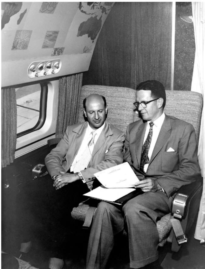
Interior del Lockheed L-1049C Super Constellation de Iberia. Período de utilización en España: 1954-1966.