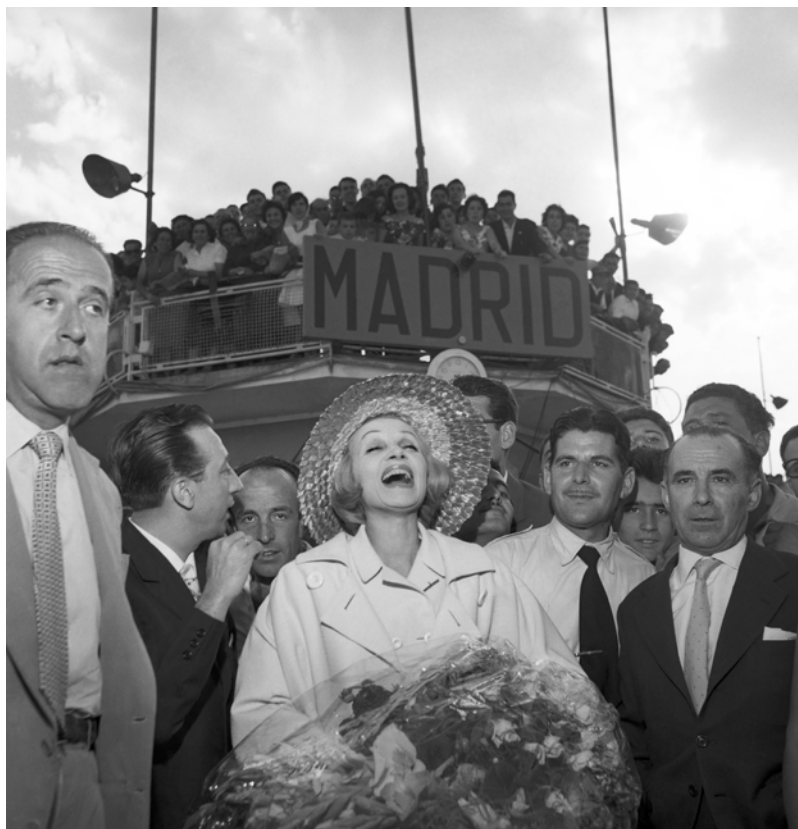
La actriz y cantante de origen alemán Marlene Dietrich a su llegada al madrileño aeropuerto de Barajas, recibida por multitud de periodistas y admiradores. Madrid, 3 de julio de 1960.