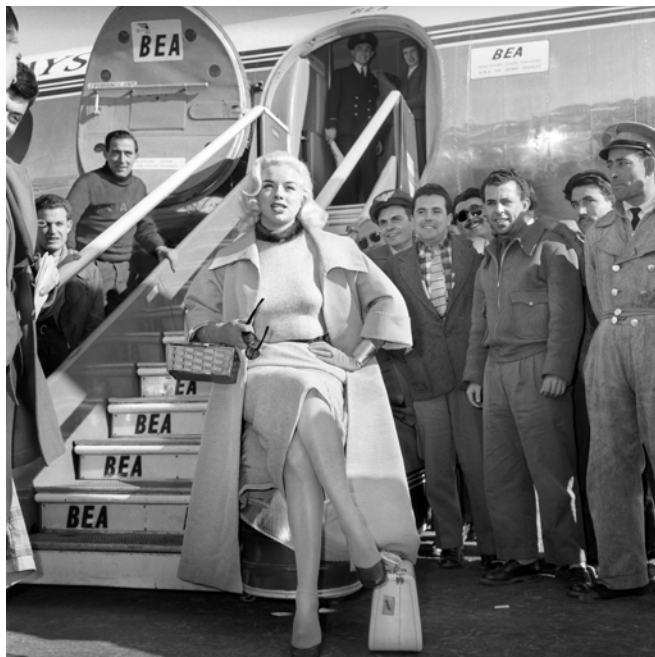
La actriz inglesa Diana Dors fotografiada en el aeropuerto de Barajas. Madrid, 22 de enero de 1957.