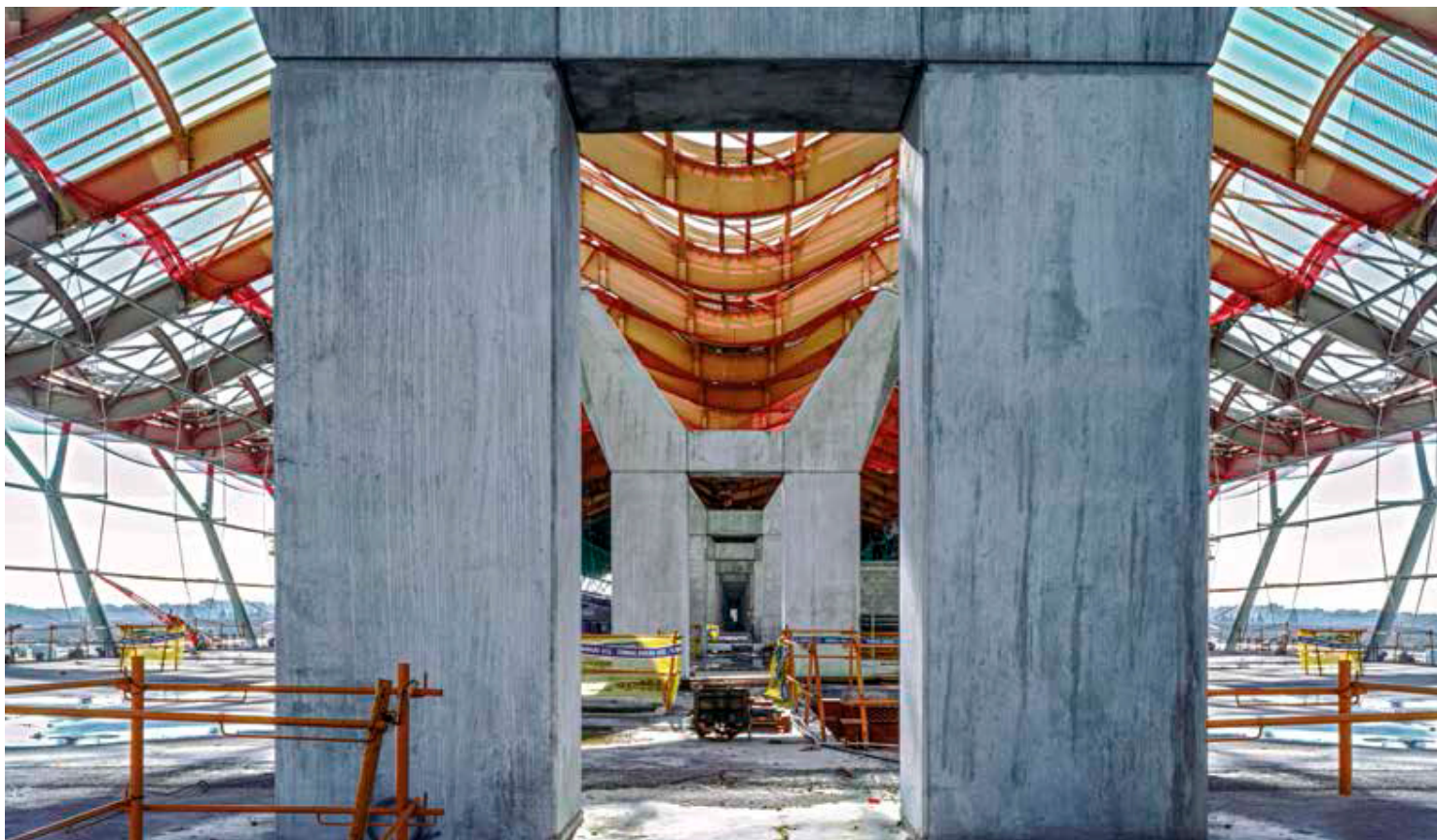
José Manuel Ballester Gran Terminal 7 , 2002. Fotografía digital sobre papel Fuji profesional Colección del artista