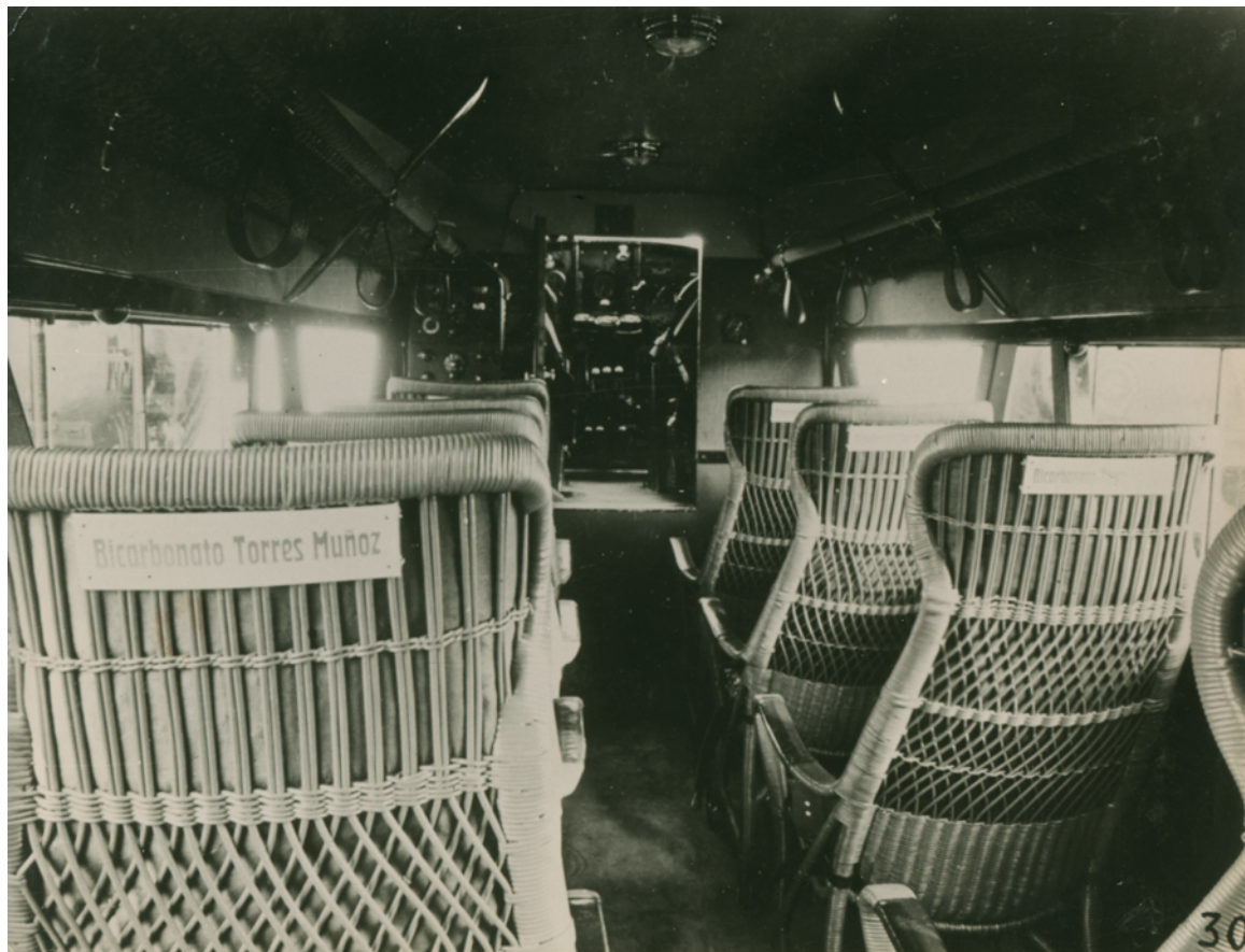
Cabina de pasajeros de un Rohrbach Roland de Iberia. Período de utilización en España: 1927-1929.

Colección Museo de Aeropuertos, Navegación y Transporte Aéreo (Málaga).