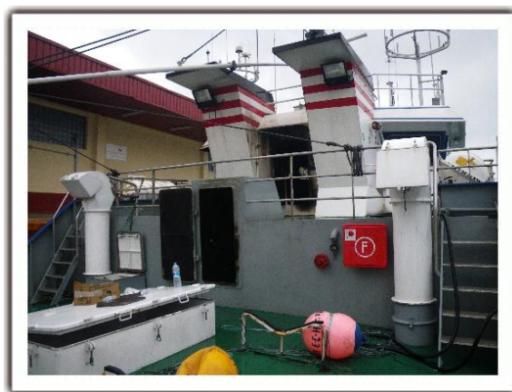
Figura 2. Puerta de acceso al alojamiento en la cubierta superior del pesquero

Seguidamente, el engrasador bajó a la cámara de máquinas, paró los sistemas de ventilación de la máquina y de aire acondicionado de la acomodación y el puente de gobierno, y cerró parcialmente las aberturas para la toma de aire. Poco tiempo después el motor principal dejó de funcionar. Sólo quedaron en marcha el motor auxiliar y una bomba de servicios generales y contraincendios, lo que permitió a la tripulación contener el incendio refrigerando la cubierta del puente y los costados exteriores del puente y de la zona de alojamientos con ayuda de tres mangueras.