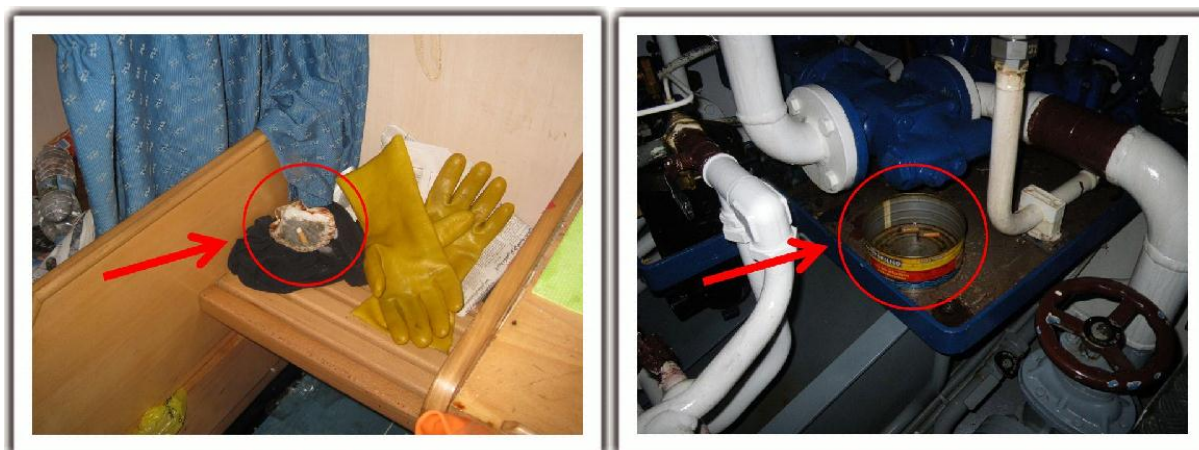
Figura 4. Colillas encontradas en uno de los camarotes y en la cámara de máquinas

La primera de las hipótesis se fundamenta en que, pese a la prohibición del armador de fumar en el interior del pesquero y a las declaraciones de algunos tripulantes que aseguraron que se respetaba la misma, durante la inspección ocular efectuada por investigadores de la Comisión se encontraron colillas de cigarrillo en un camarote y en la sala de máquinas. Estas colillas estaban en recipientes utilizados como cenicero, susceptibles de vuelco por el balance en la mar y próximos a materiales combustibles. Ello hace pensar que una colilla mal apagada podría haber caído de su cenicero produciendo calor suficiente como para desencadenar el incendio.