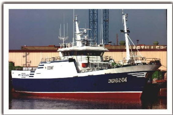
Figura 3. Pesquero REY DE OLAYA