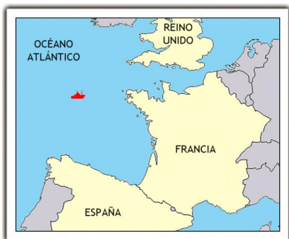
Figura 1. Localización del accidente

El relato de los acontecimientos se ha elaborado a partir de las declaraciones de los testigos y de otros documentos. Las horas referidas a lo largo del informe son locales de España.