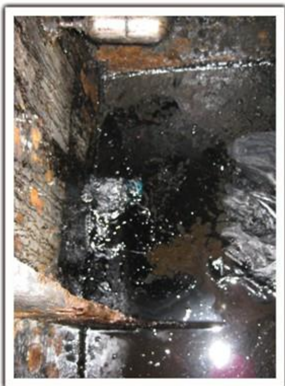
Figura 2. Filtración de combustible dentro del tanque de aguas grises