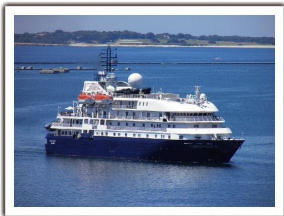
Figura 4. Buque de pasaje CORINTHIAN II