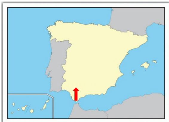
Figura 1. Localización del accidente

El relato de los acontecimientos se ha elaborado a partir de la información procedente de la compañía responsable del barco. Las horas referidas a lo largo del informe son locales.