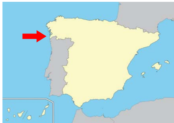
Figura 2. Zona del accidente