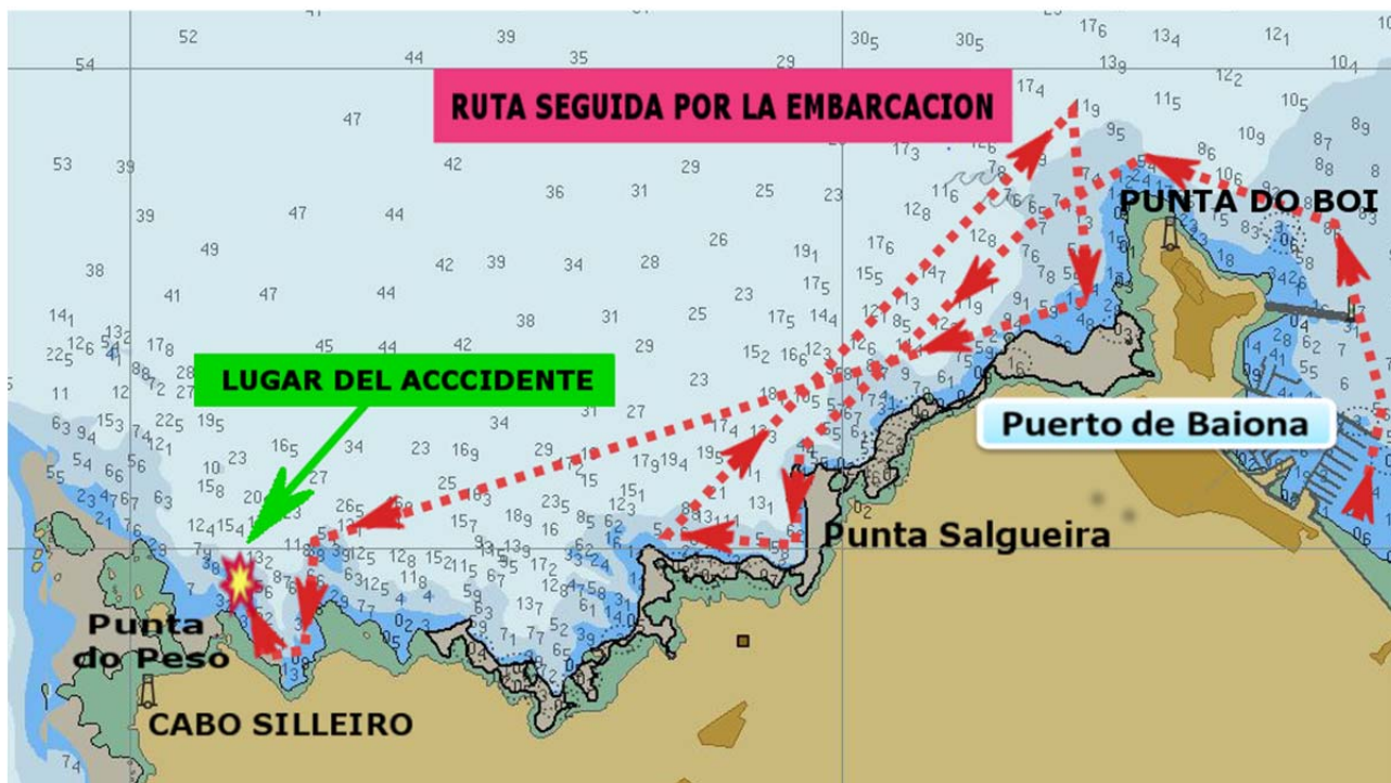
Figura 3. Ruta seguida por la embarcación el día del accidente

El relato de los acontecimientos se ha realizado a partir de los datos, declaraciones e informes disponibles. Las horas referidas son locales.