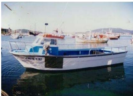
Figura 1. Embarcación de pesca Nuevo Vanesa