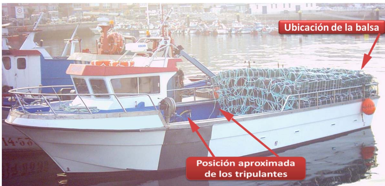
Figura 6. Embarcación similar a la E/P NUEVO VANESA, cargada de nasas

Los aros salvavidas presumiblemente se hallaban trincados. La embarcación pasó de estar adrizada a escorarse hasta perder por completo el par adrizante y quedar quilla al sol, para recuperar otra vez su adrizamiento. En este movimiento los aros salvavidas no se movieron de su emplazamiento, véase Figura 4.