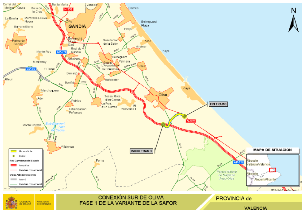
CONEXIÓN SUR DE OLIVA FASE 1 DE LA VARIANTE DE LA SAFOR