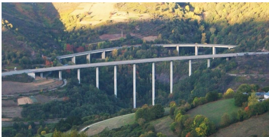
Viaducto de Silvela (primer término)