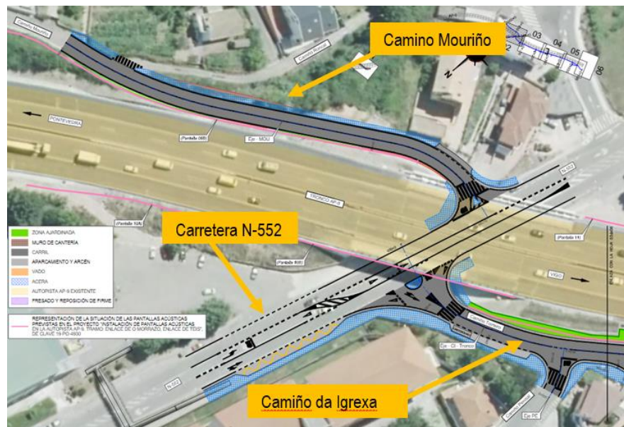
Detalle de la planta de actuación: reordenación de las intersecciones de Camiño Mouríño y Camiño da Igrexa con la carretera N-552 en el entorno del PK 150+500 de la AP-9.