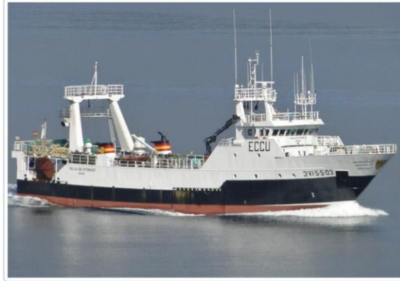
Pesquero Villa de Pitánxo

MINISTERIO DE TRANSPORTES, MOVILIDAD Y AGENDA URBANA