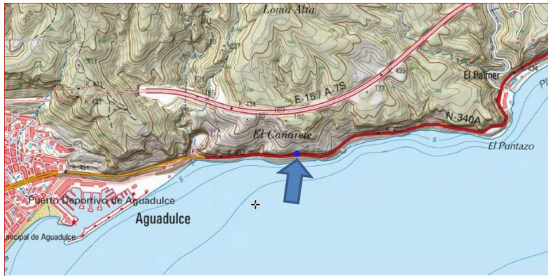
Ubicación de la actuación