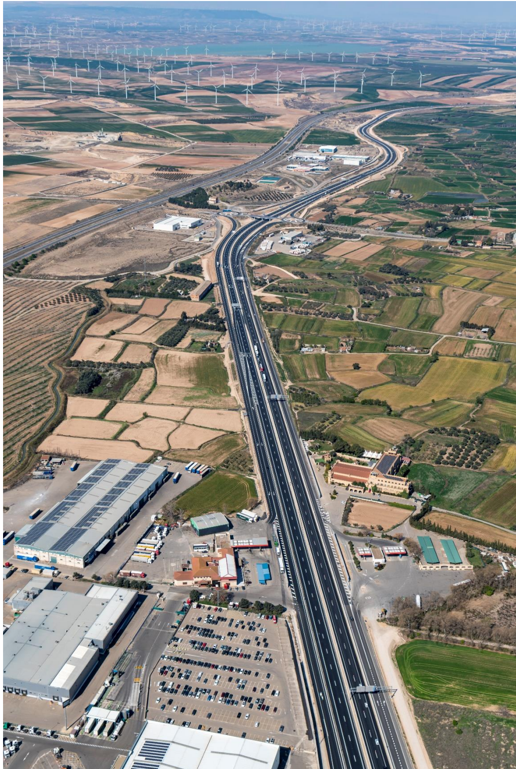
Perspectiva general de la A-68