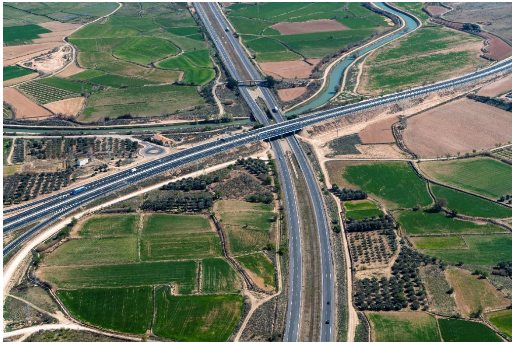
Viaducto sobre AP-68