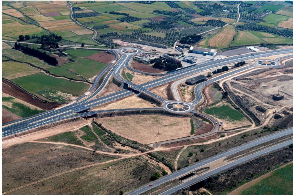
Enlace de Luceni