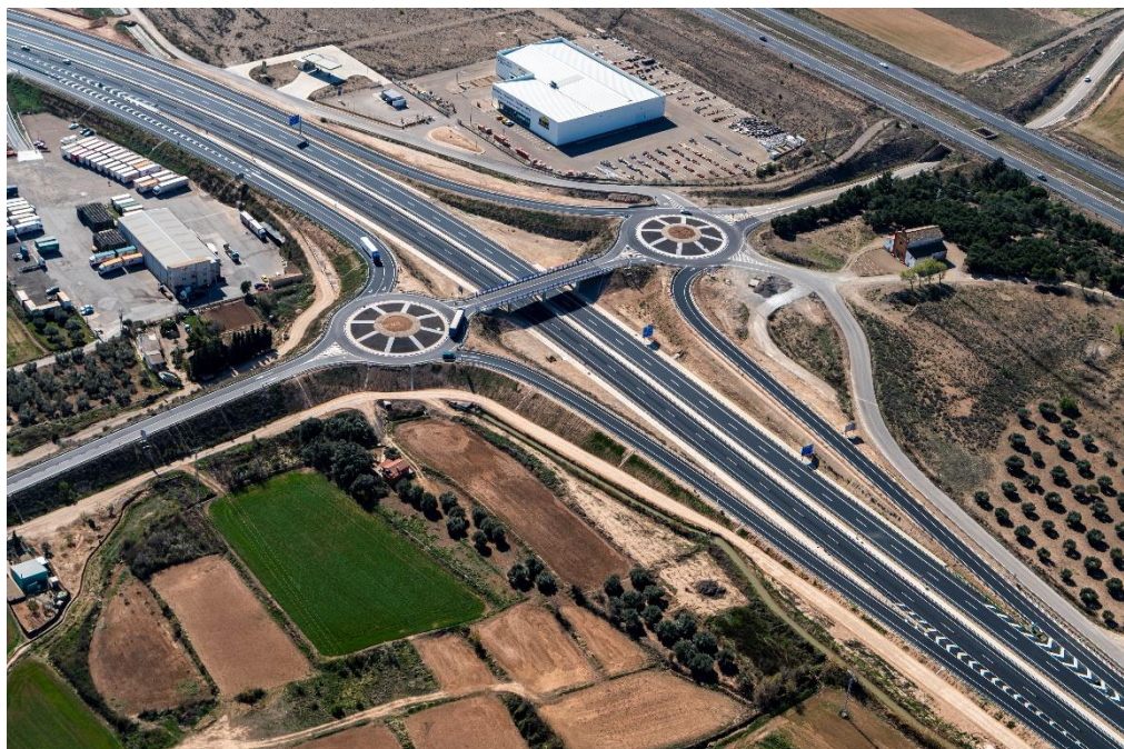
Enlace de Pedrola Oeste