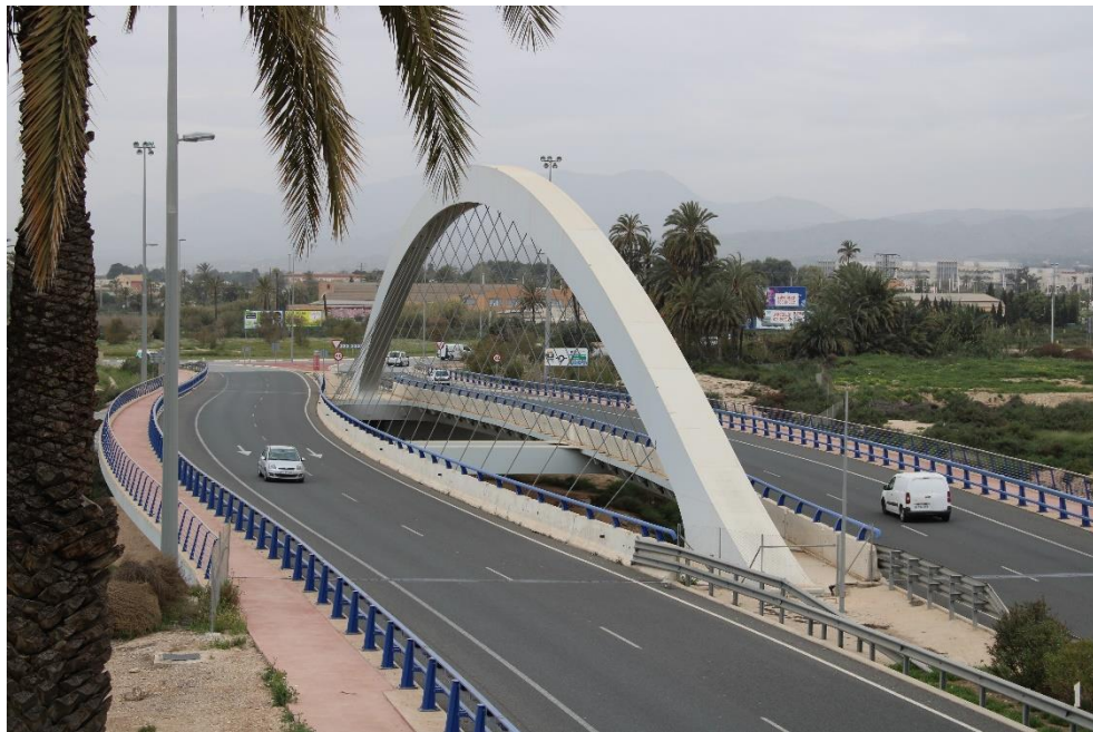
Puente sobre el río Vinalopó