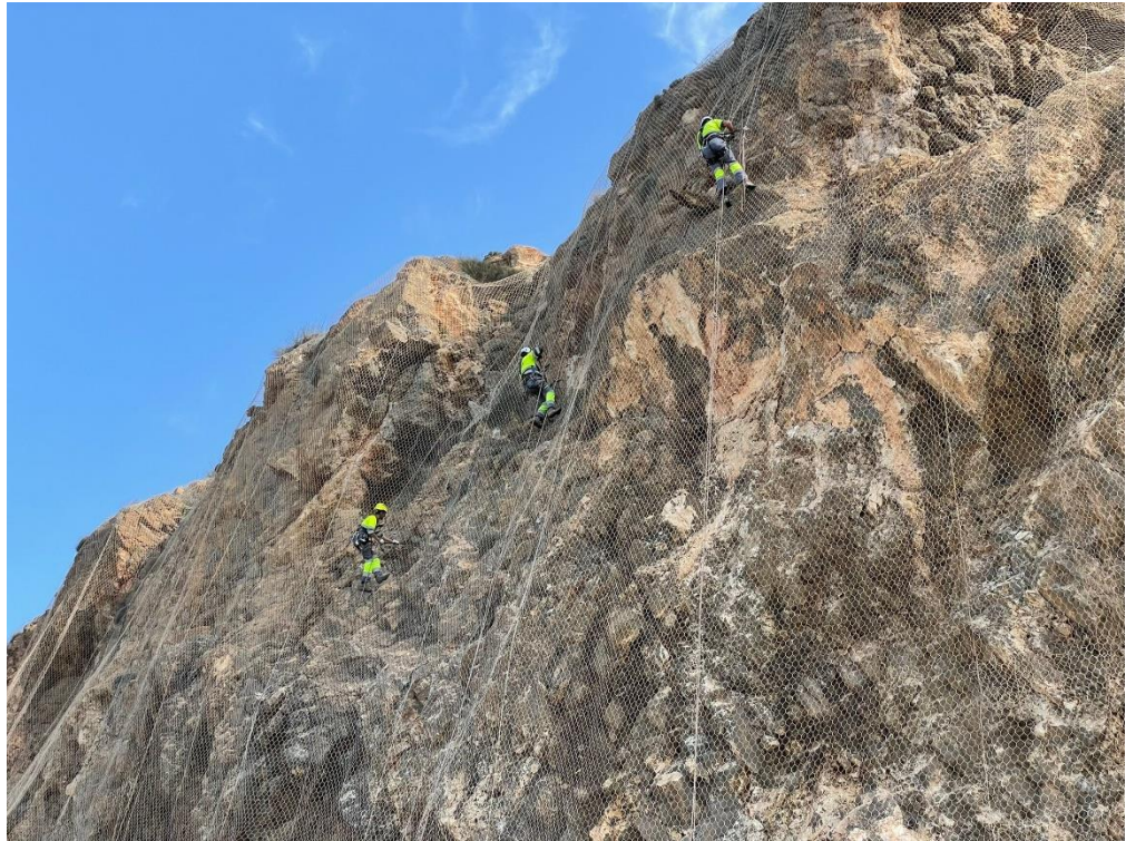
Saneamiento del talud