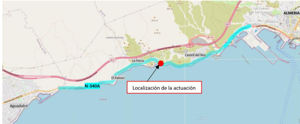
Localización de la actuación