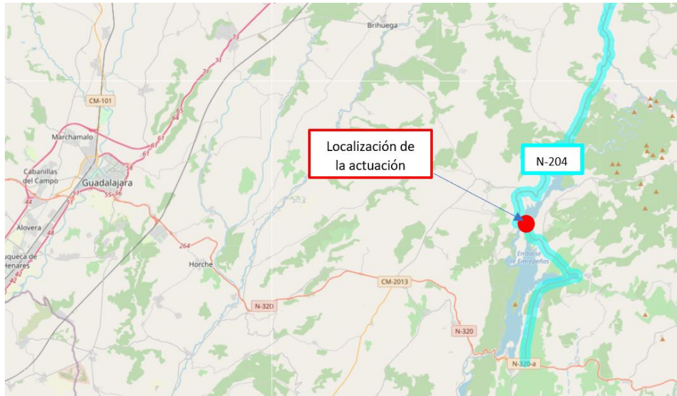
Ubicación de la actuación