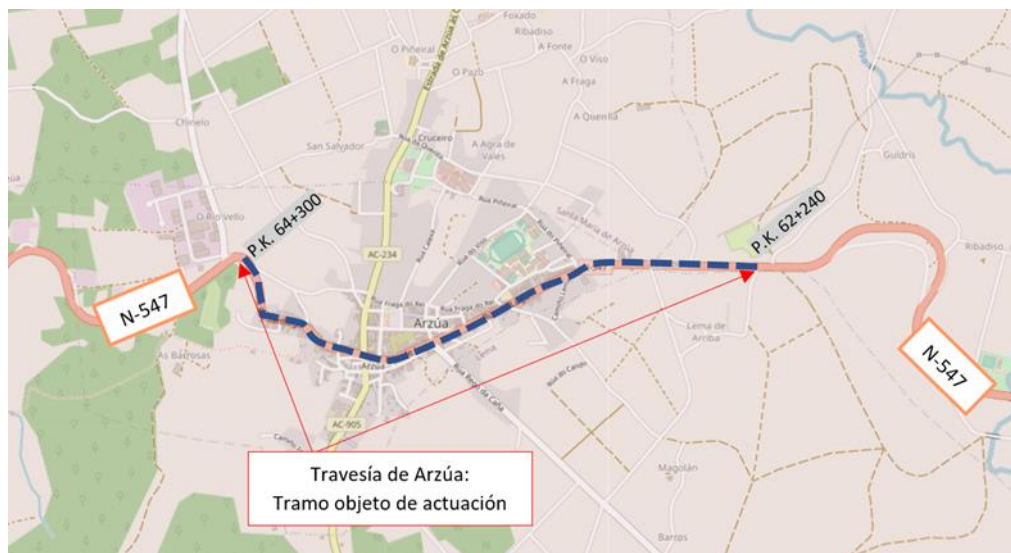
Travesía de Arzúa: Tramo objeto de actuación