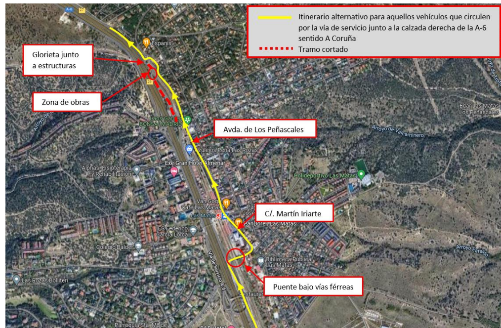
Itinerario alternativo para aquellos vehículos que circulen por la vía de servicio junto a la calzada derecha de la A-6 sentido A Coruña

Se muestra a continuación una imagen con el desvío descrito: