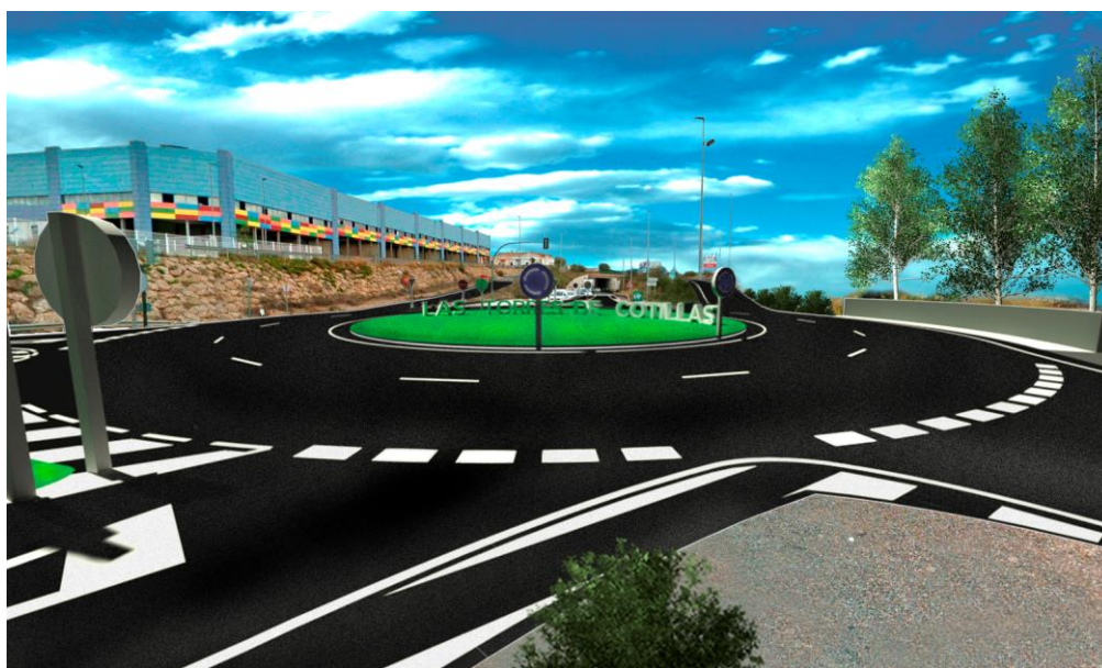
Infografía de la actuación