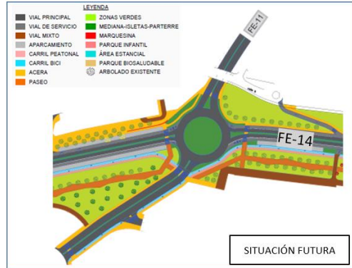
Conexión FE-11 con FE-14. Situación actual y situación futura