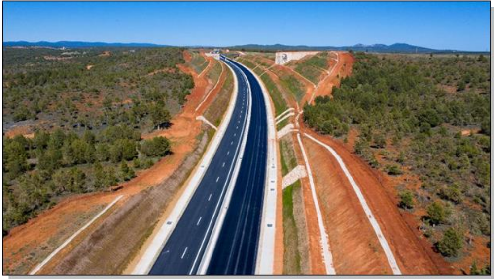
Trincheras de subida al páramo de Calatañazor