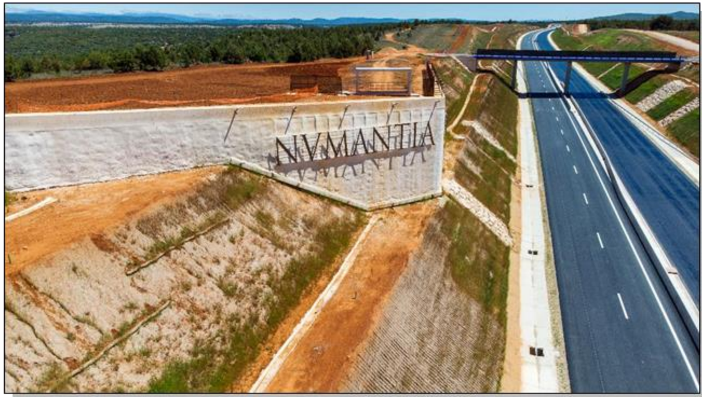
Zona de afección a la Vía Romana