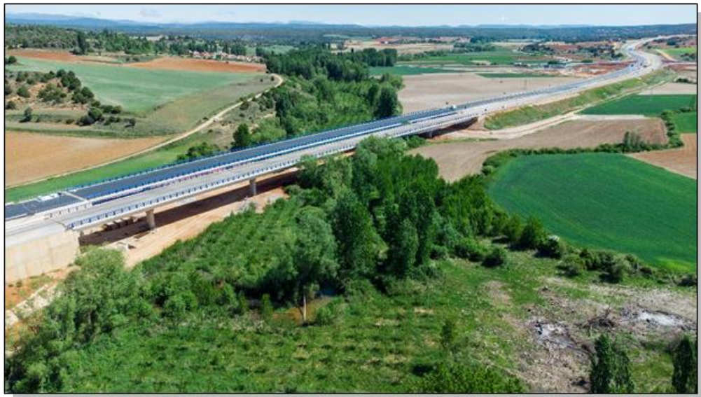
Viaducto sobre el río Abión