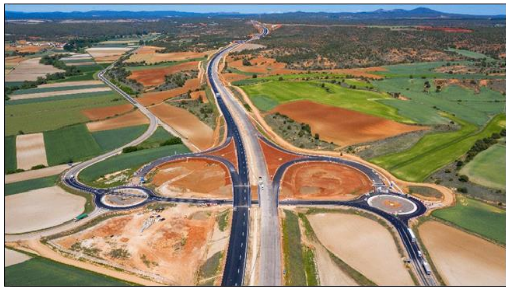
Enlace de Torreblacos