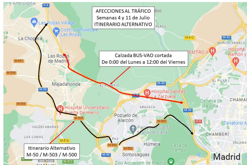
Itinerario alternativo por el corredor M-50 / M-503 y M-500

Como itinerario alternativo, se recomienda el corredor M-50 / M-503 / M-500 tal y como se muestra a continuación: