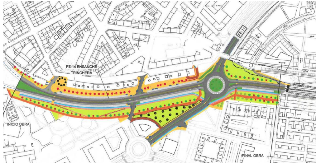
Tramo 1 tras la actuación

La sección tipo transversal actual, de 2x2 carriles, será sustituida por una sección 'humanizada' que mantendrá los dos carriles por sentido, pero destinando el izquierdo a la circulación y funcionando el derecho como vía de servicio, dando acceso a las intersecciones, aparcamientos y paradas de autobuses. Asimismo, se proyecta la creación de amplias zonas verdes en ambas márgenes, construcción de aparcamientos, carril bici y carril peatonal, e instalación de alumbrado y semáforos.