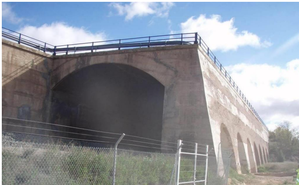
Embocadura norte y aligeramientos laterales