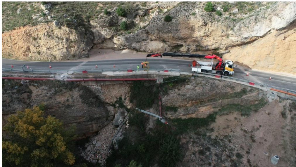
Trabajos previos de desvío de servicios afectados