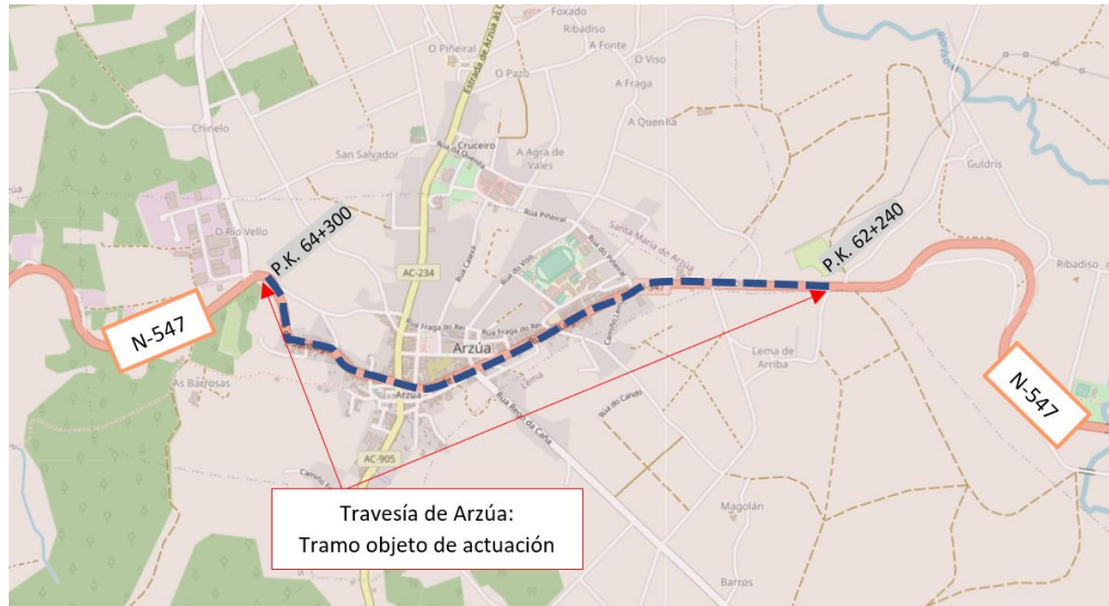
Travesía de Arzúa: Tramo objeto de actuación