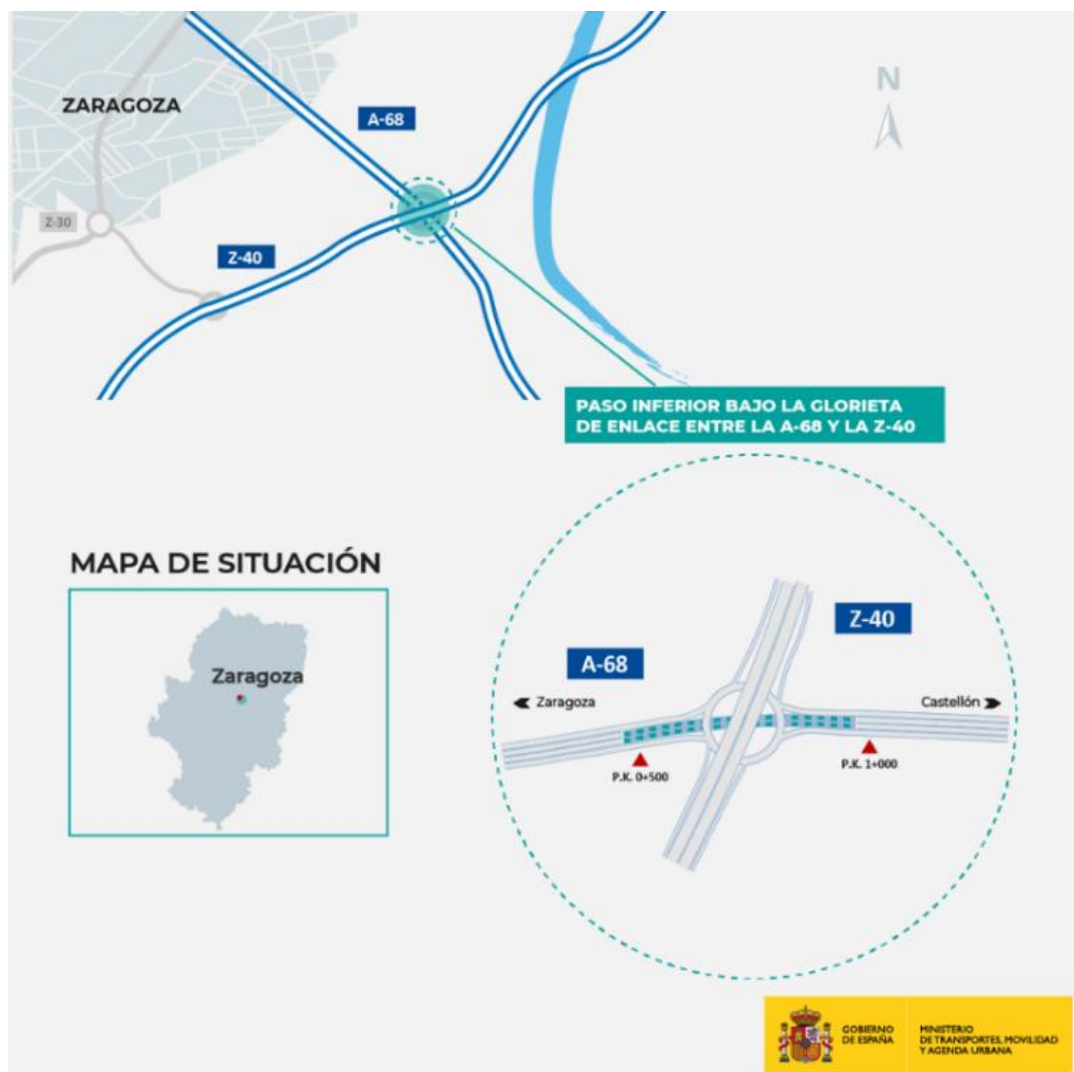
Croquis ámbito de actuación.

Para solucionar los problemas de congestión y mejorar la seguridad viaria de la zona, el secretario general de Infraestructuras ha recordado que en el mes de noviembre se han licitado, por 23 millones de euros (IVA incluido), las obras para la construcción de un paso inferior bajo la glorieta del enlace, de manera que canalice el tráfico que circula por la A-68 y no necesite acceder a la Z-40, no tendrá que cruzar la glorieta del enlace.