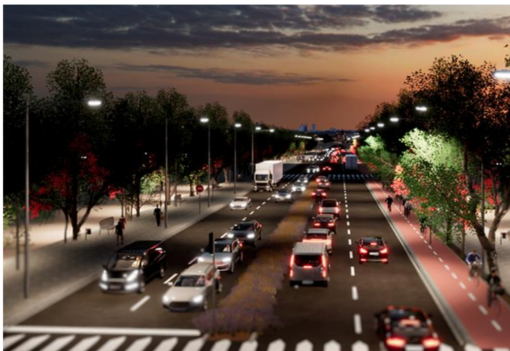
Simulación 3D actuaciones proyectadas (1)