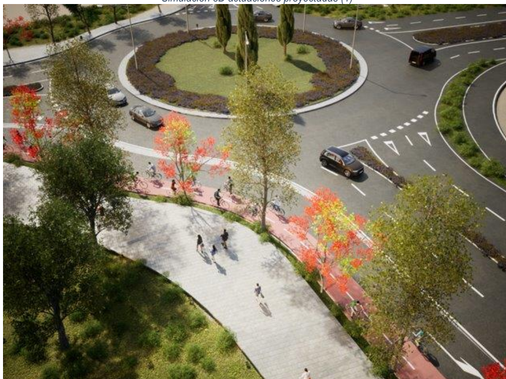
Simulación 3D actuaciones proyectadas (2)