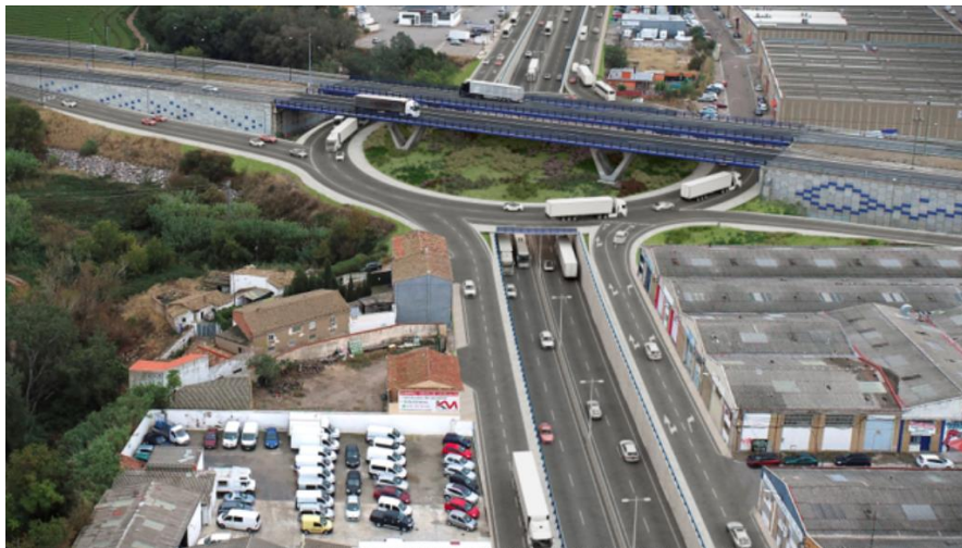
Situación actual y Simulación 3D del nuevo paso inferior